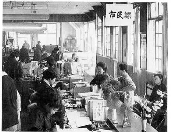
▲昭和30年代の市役所の窓口

手前の大理石のカウンターにいる白衣姿の男性行員は、出納係という現金取り扱い担当者。現在なら、現金は機械で選別し数えますが、当時はすべて手作業でした。その