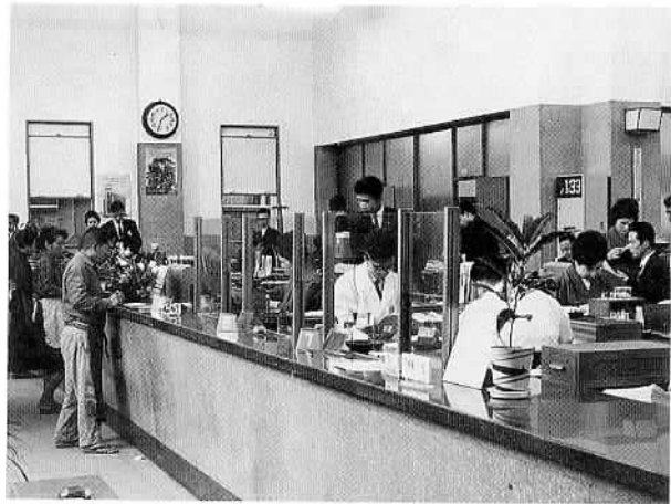
●銀行と市役所の窓口