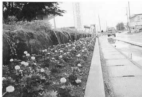
▲石岡の風景⑥市役所前のマリーゴールドの花壇