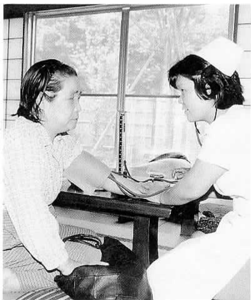
▲デイサービスでお年寄りは気分爽快(6月7日) 在宅の体が弱いお年寄りは、石岡デイサービスセンター一華翠会館を利用できます。送迎はバスでします。お年寄りたちは、入浴、健康チェックに心身ともにリフレッシュ。利用希望者は市役所社会福祉課へ。