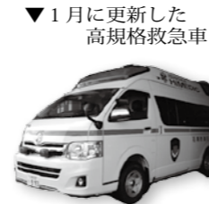
▼1月に更新した高規格救急車

救急出場件数は、毎年増加しています。平成 24 年は、前年より 113 件増加しました。搬送人員も 117 人の増加です。これは、市民の約 25 人に 1 人が救急車を利用したことになり、1 日あたりの出場件数は、約 9.2 件です。