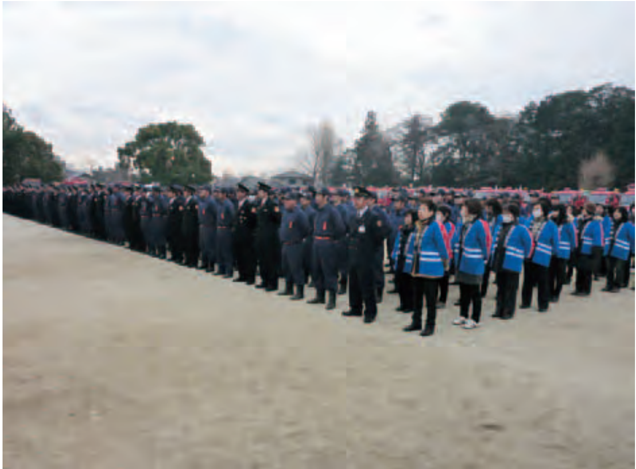
▲参加者の集合風景(石岡小学校校庭)