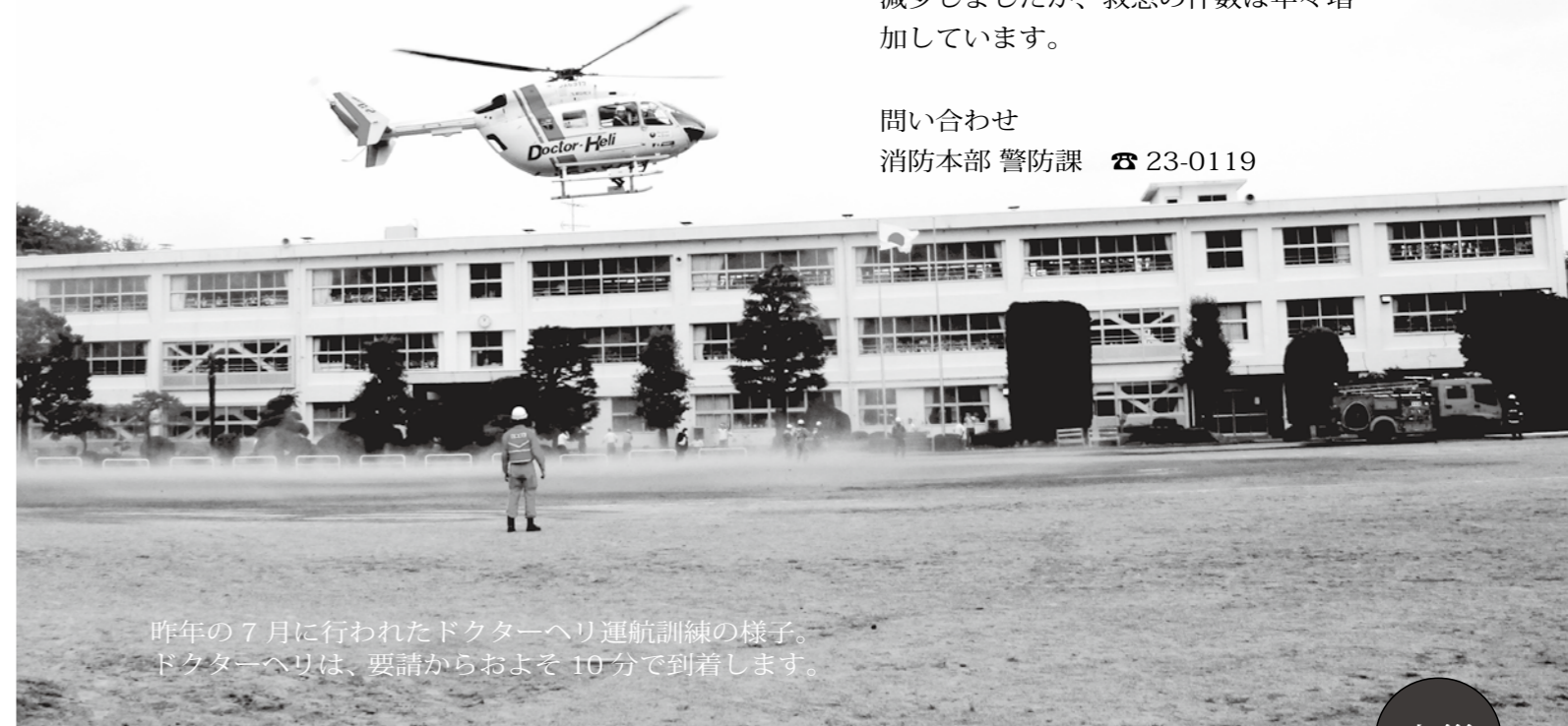
昨年の 7 月に行われたドクターヘリ運航訓練の様子。ドクターヘリは、要請からおよそ 10 分で到着します。