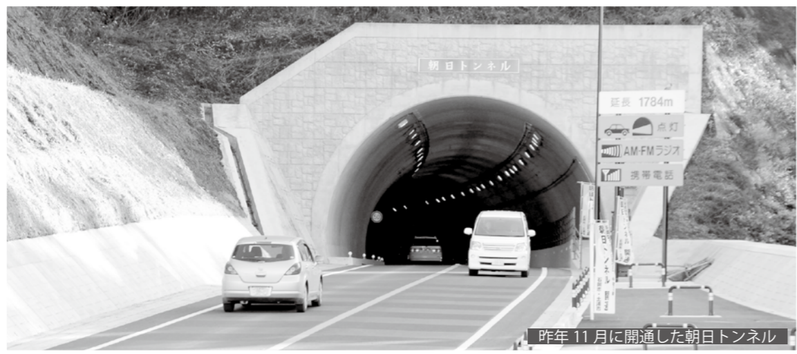
昨年11月に開通した朝日トンネル