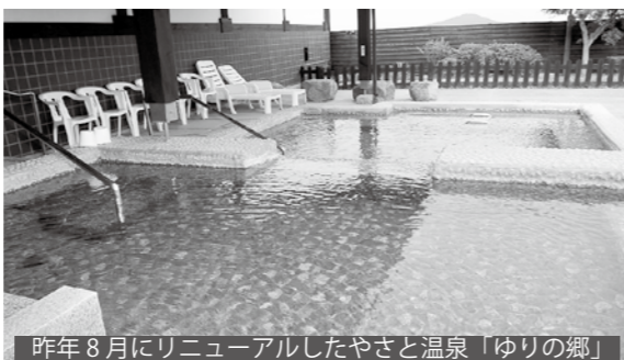
昨年8月にリニューアルしたやさど温泉「ゆりの郷」