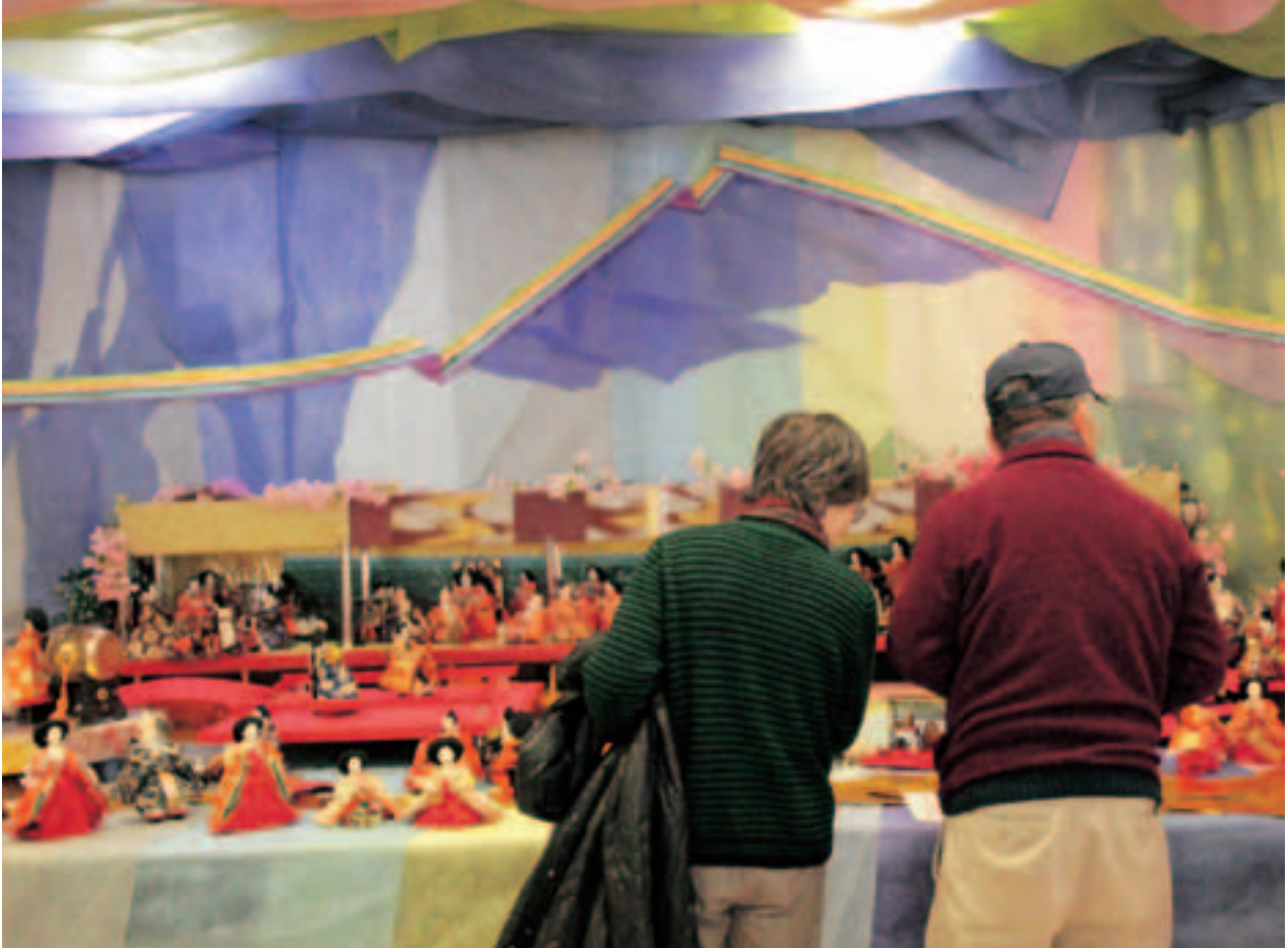
▲まちかど情報センターの情景飾り「源氏物語 EMAKI2013」