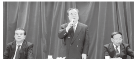
▲知事との懇談会 「知事との懇談会に緊急に実施します」との回答を得ました。

合流する場所の管理について要望すると「堤防の内側の竹や篠などが、流水の障害となり冠水の要因となっているため、それら障害物の除去について、早急に対応して実施します」との回答を得ました。