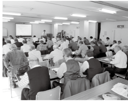
▲飯田市で行った意見交換会

飯田市では「ムトス」という言葉を合言葉に、協働のまちづくりを進め、様々な地域活動を実施していました。当会においても、今後のまちづくり推進の参考にしたいと思います。