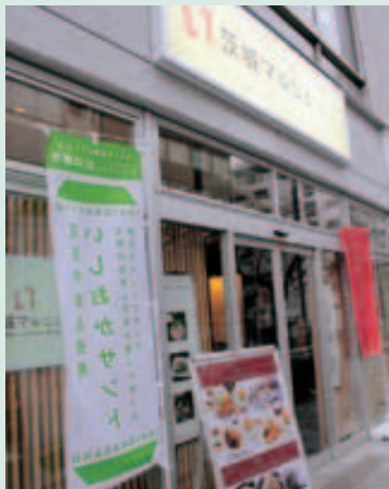
▲茨城県のアンテナショップ「茨城マルシェ」

2月16日から28日まで、銀座（東京都）にある茨城県アンテナショップ「茨城マルシェ」のレストランで3種類の「いしおかサンド」を販売することになりました。