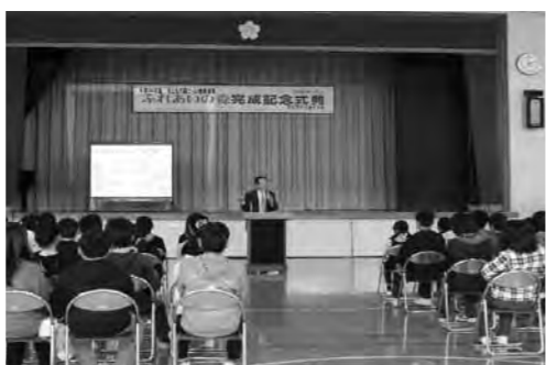
▲完成式典での緑の講話(小桜小体育館)

吉生小学校と小桜小学校で、学校敷地内やその周辺に児童が自然観察や体験活動などを行う施設が完成し、3月5日と8日にそれぞれ完成式典を開催しました。