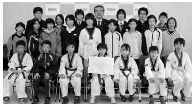
▲スポーツ振興奨励表彰受賞者