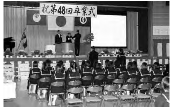
▲有明中の卒業証書授与

今回が最後の卒業式となる柿岡・有明・八郷南の各中学校では、それぞれ100人・35人・34人の生徒が、在校生や先生、保護