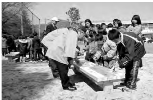
▲木製ベンチに塗装する児童(吉生小校庭)

した「ふれあいの森」に、新たに木製のテーブルやベンチ、トームポールを設置したほか、植樹も行いました。 今後、両校では整備した施設を利用して、野外観察や自然体験などに取り組んでいくとともに、保護者や地域の人々との交流の場として活用していきます。