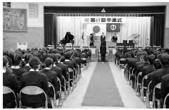
▲柿岡中学校の卒業証書授与

3月12日に、市内の8中学校で卒業式が行われ、779人が卒業しました。19日には、市内19小学校で卒業式が行われ、742人が卒業しました。