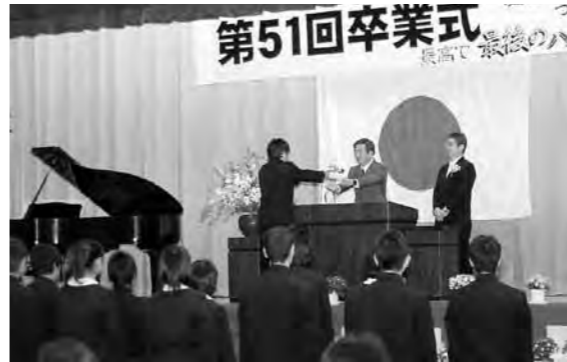
▲八郷南中の卒業証書授与

今回が最後の卒業式となる柿岡・有明・八郷南の各中学校では、それぞれ100人・35人・34人の生徒が、在校生や先生、保護