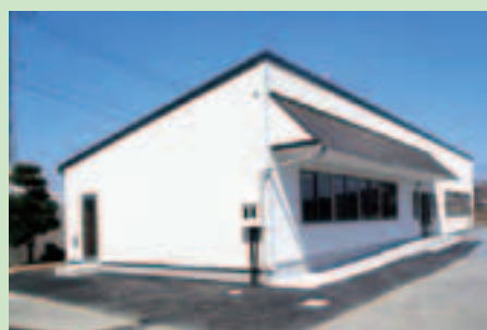
▲敷地内に建てられた学童保育専用施設