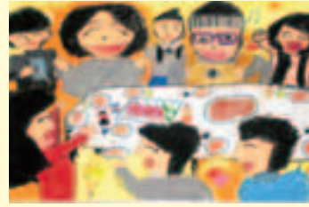
最優秀賞 「みんなで楽しいお正月」 佐久間 星来 (杉並小2年)