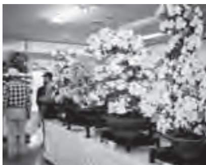
▲丹精込めて育てられたさつきが並ぶ会場

6月6日から10日の5日間、県フラワーパーク展示場で石岡盆栽会八郷支部主催の第37回さつき展示会が開催されました。展示会には、市内のさつき盆栽愛好者による力作、40点が飾られました。会場を訪れた人は、赤やピンク、白などの花をつけた見事なさつきを熱心に鑑賞していました。