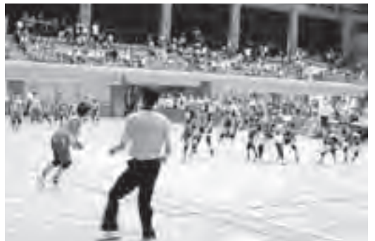
▲熱戦が繰り広げられる4~6年生の部

子ども会球技大会(男女混合ドッジボール)が、石岡運動公園体育館で行われました。当日は、市内小学校から1~3年生の部に15チーム、4~6年生の部に29チーム、合計44チーム648人の選手が参加し、白熱した試合を繰り広げました。