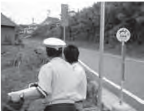
▲警察官から指導を受ける自転車利用者

ことはできません。違反をすると懲役や罰金など重い罰則があります。当日、指導を行った人からは「他の人が通っているから自分も、と考えず、しっかりと交通ルールを守って行動してほしい」との声が聞かれました。