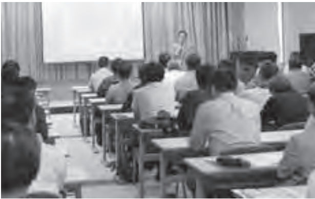
▲6月16日開催のセミナー風景

市と石岡商工会議所 中心市街地活性化協議会ではサポート・ワンを会場に「元氣いしおかまちづくり市民セミナー」を共同開催