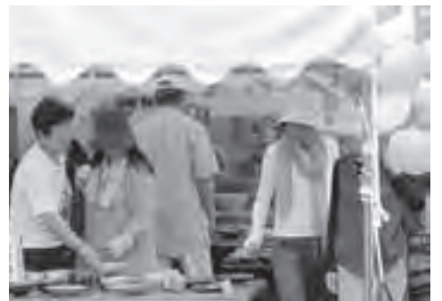
▲気に入った陶器を探す来場者

ため、多くの人でにぎわいました。来場した人は、陶器を手にとつて眺めたり、陶芸家と直接話したりしながら、自分のお気に入りの陶器を見つけようと会場内のテントを巡りました。