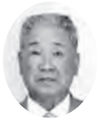
瑞宝双光章(消防) 比氣 道之助 (元石岡市消防正監)