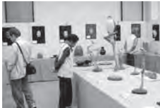
▲作品を鑑賞する来場者(八郷総合支所)