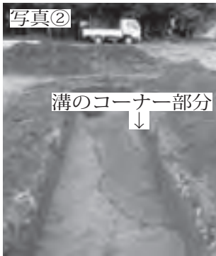
写真② 溝のコーナー部分

の「郡寺」であることが判明し、これらのことが評価され、市の文化財(史跡)に指定されました。