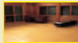
多目的室 1回2,100円 ※宿泊はできません。