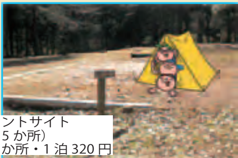
テントサイト (15か所) 1か所・1泊320円

石岡市龍神の森キャンプ場は バーベキューサイト2か所、テン トサイト15か所を備えた、森の 緑に囲まれた自然の中にある静か なキャンプ場です。