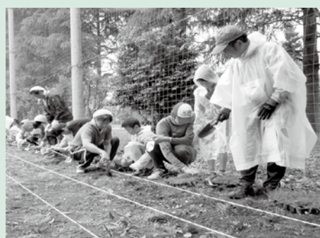
▲雨の中での芝生の移植作業

長年、サッカープレイヤーを支えてきた柏原サッカー場の芝生は、損傷が目立つ状態になっていました。その状況に、市の体育協会サッカー部が立ち上がり「このグラウンドを何とかしたい」と市に相談しました。そこで、市は(財)日本サッカー協会の「ポット苗方式芝生化モデル事業」に申請。ポット苗約3万5000株を無償で提供してもらいました。 苗の移植は、柏原サッカー場を利用する市内の少年団や中高生、社会人チームなどがボランティアとして参加してくれることになりました。 6月16日に18団体371人が参加し、雨の降る中で8550㎡のグラウンドに、苗の移植作業を行いました。苗の運搬作業や肥料などのメンテナンスは、市が実施しました。 こうして、柏原サッカー場は「このグラウンドをよみがえらせよう」との思いのもとに、利用者、サポーター、市が互いの立場を生かして協力し、協働で芝生の再生活動を行いました。 参加者からは「雨が降る中、みんなで協力して苗の移植を頑張りました」「芝生が成長したグラウンドでサッカーをするのが待ち遠しいです」などの声が寄せられました。 ●苗の成長状況は、市のホームページ ( http://www.city-ishikaga.jp/ ) の教育情報で確認できます。 ※今後も、市民協働による取り組みを、随時知らせます。