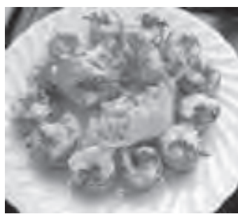
★このレシピはヘルスメイトさんのおすすめメニューです。