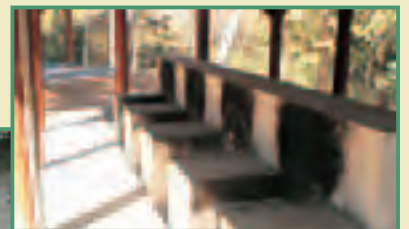
炊き場・炊事場 (8か所) 1回320円

※1か所につき10名程度利用できます。 ※食材、木炭などは各自持参ください。 ※バーベキューサイト、テントサイトの利用料金には炊き場・炊事場の利用料金も含まれています。