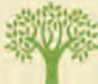
シャワー室 (4か所) 1回530円