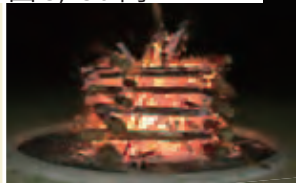
キャンプファイヤー場 1回3,150円

※キャンプファイヤーを実施するときは、利用者が生活環境課と石岡消防署に届け出ください。