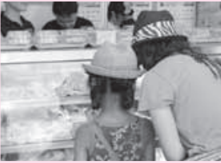
▲販売開始イベント(まちかど情報センター)

今年の4月から始まったいしおかオリジナルスイーツづくり。ついに、7月28日から市内11か所の参加菓子店で「いしおかサンド」の販売を開始しました。また、同日販売開始イベント