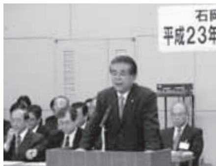
▲昨年の市政懇談会の様子

⑤ まちづくり事業の展開 地区内事業の活性化や安全・安心のまちづくりの推進、区内未加入者の解消、青少年の健全育成などの活動を展開します。