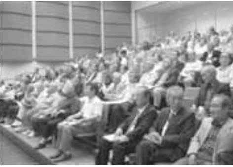
▲平成24年度総会の様子

5月17日、ふれあいの里石岡ひまわりの館で、市長、市議会議長、戸井田県議会議員を来賓に迎え、136人の区長が出席して、平成24年度の総会を開催しました。