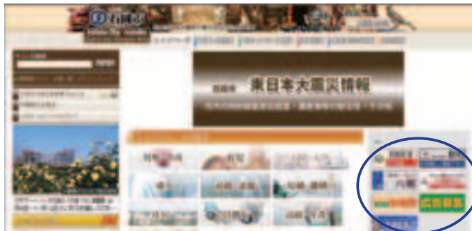
▲ホームページのトップページ