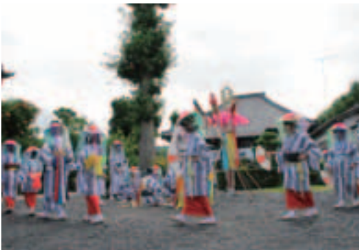
▲伝統の舞を披露する踊り子(福寿院境内)

当日は、市内外から多くの人々が訪れ、会場内はにぎわいました。途中、突然の雨に降られることもありましたが、揃いの衣裳と花笠を身につけた踊り子たちは、太鼓や笛に合わせて厳かに舞を披露しました。