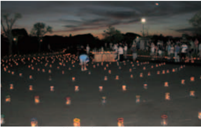
▲キャンドルが灯された会場（柏原池公園）

当日は、ボランティア団体関係者や市民など約400人が参加して、1000個以上ある手