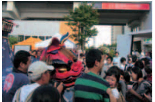
▲獅子の巡行に泣き出す子どもや写真に収める見物人

当日、会場内を石岡の獅子や山車が巡行すると、見物人から大きな歓声や拍手が起こりました。また、子どもやその親たちが、楽しそうに山車を押したり綱を引いたりする姿が見られました。持参した農産品や「いしおかサンド」は、すべて完売しました。