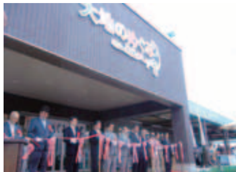
▲直売所入口で行われたテープカット

農産物販売コーナーには地元産の新鮮野菜が並ぶほか、これらの食材を使った惣菜を扱う「惣菜工房かあちゃんかふえ」、地元産の小麦粉を使って焼いた手作りパン工房「こむぎや」などがあります。