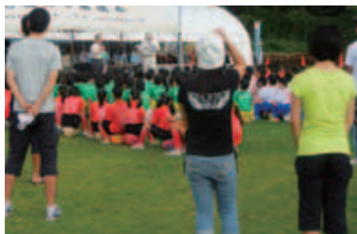
▲開会式の様子(ばらきサッカークラブ碓石グラウンド)

社会を明るくする運動石岡市推進委員会では、犯罪や非行のない明るい地域社会を築こうと、7月から9月にかけて街頭やイベント会場など5か所で啓発活動を行い、約