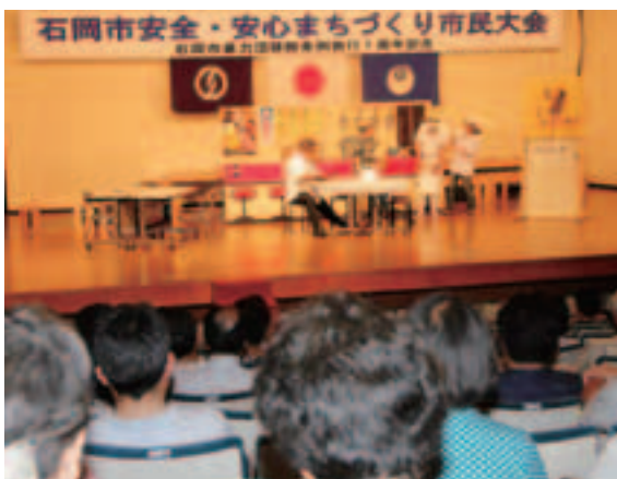
▲不当要求への対処法を寸劇で披露する警察署員(石岡市民会館)

8月26日、市と警察署、教育委員会主催で、暴力団排除条例施行1周年を記念した「安全・安心まちづくり市民大会」を石