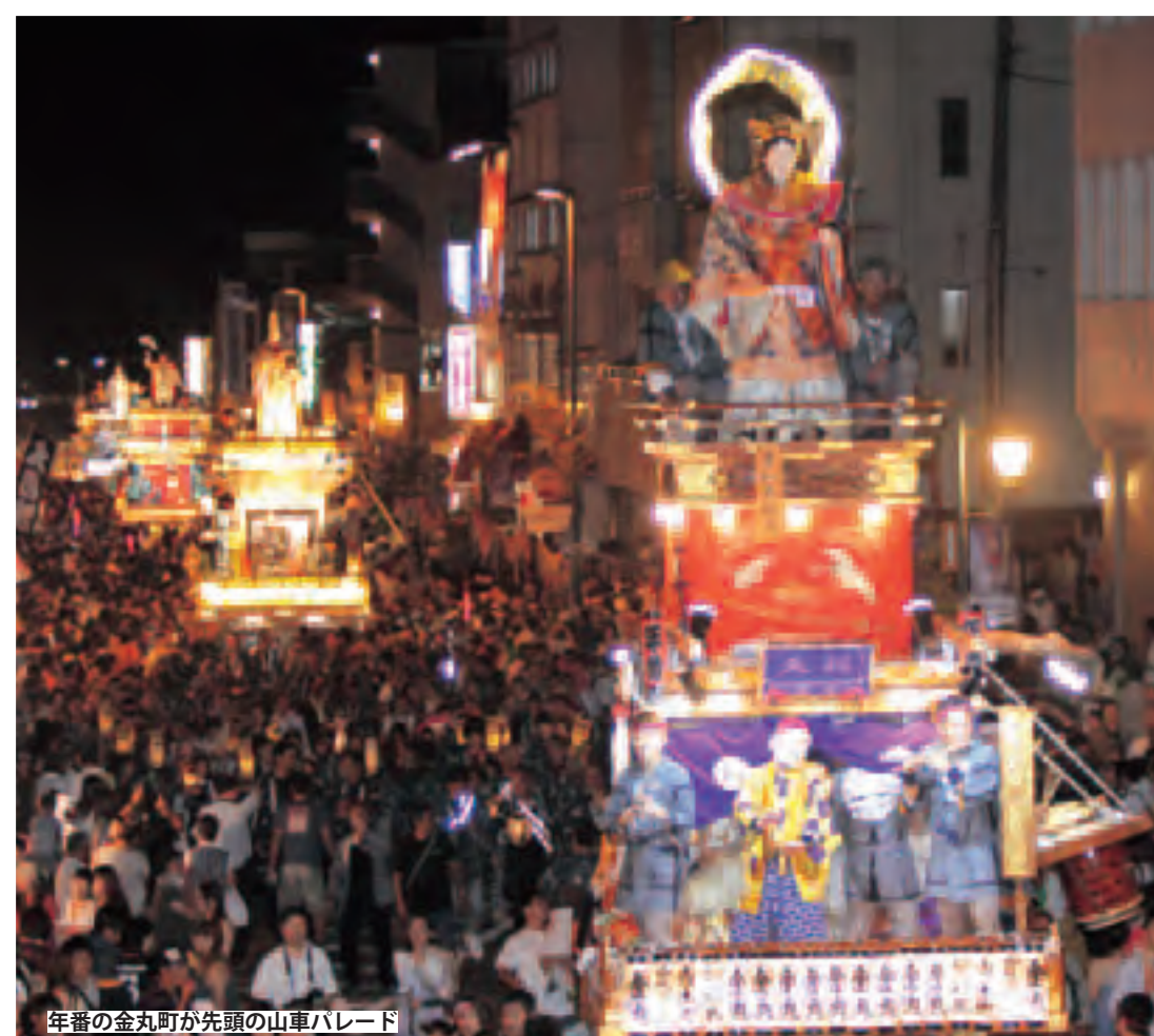
年番の金丸町が先頭の山車パレード