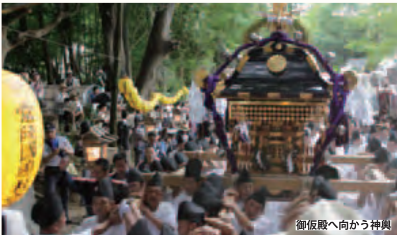
御仮殿へ向かう神輿