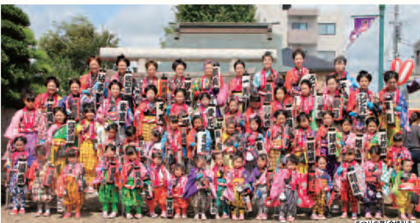
まつりの華「金棒引き」