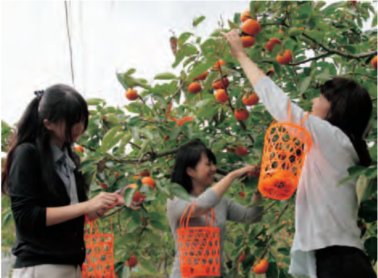
▲十三塚の果樹団地内にて