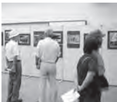
▲写真を鑑賞する来場者(八郷総合支所)

は、7チームによる団体競技が行われ、身体障害者福祉協議会とけやきの家の合同チームが優勝しました。参加者は、秋の一日を仲間や家族とスポーツで楽しみました。