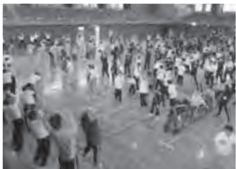
▲開会式で行われた準備体操(石岡運動公園体育館)

この大会は、スポーツを通じて障がい者の体力の維持増進を図り、自立と社会参加の意欲を高めることを目的に開催されています。午前中の個人競技では、一生懸命走る姿に声援や拍手が送られました。昼食時には、石岡中吹奏楽部の演奏や木村フィットネススクールのダンスが披露されました。午後から