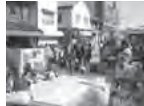
家族秋祭り・段ボール商店街（段ボールのお手製遊び場）