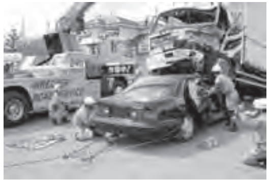
▲民間業者と連携して行った大規模交通事故対応訓練

1kmあたり10〜15分のペースで歩きました。ゴール地点には、新米のおにぎりと豚汁が用意され「運動の後の食事はおいしいね」と、おにぎりを頬張る人や、豚汁をおかわりする人の姿が見られました。