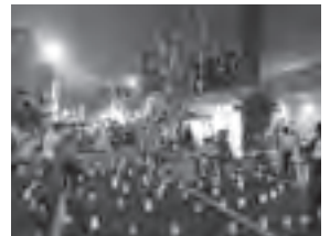
七夕まつり・復興の灯火（キャンドルナイト）