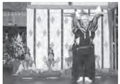
▲第二座の老翁（おきな）の舞

八幡神社で、地元の保存会により太々神楽が奉納されました。 市の無形民俗文化財に指定されているこの神楽は、毎年旧暦の8月15日の中秋の名月の日とその前日の夜に行われ、地元では「柿岡のジャカモコジャン」と呼ばれて、親しまれています。 当日は、午後7時から11時すぎまでの4時間以上にわたり、猿田彦や山の神などの十二座神楽と巫女舞が奉納されました。夜もふけてくると、地元の小学生から選ばれた巫女の眠そうな姿が見られました。