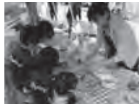
めぐみの朝市・野菜ソムリエによる料理教室

商店街が、市民の活躍の場「まちの舞台」となり活性化することを旨とする、御幸通り商店街の活動を紹介します。