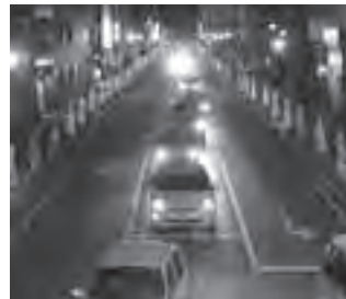
御幸通りを彩るイルミネーション