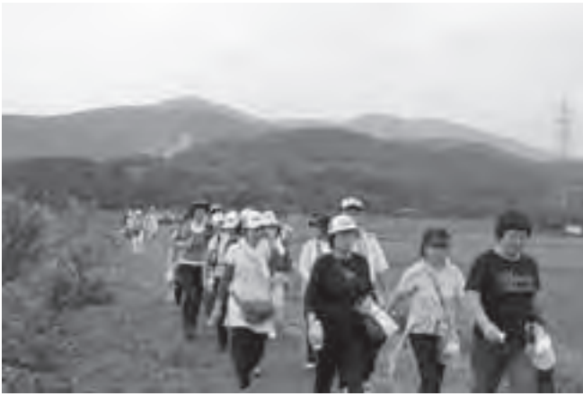
▲秋空のもと、ウォーキングを楽しむ参加者

当日は、少し汗ばむくらいの陽気の中、参加者は、風土記の丘から畜産センター、恋瀬川サイクリングロードを経て風土記の丘に戻る約10kmのコースを、