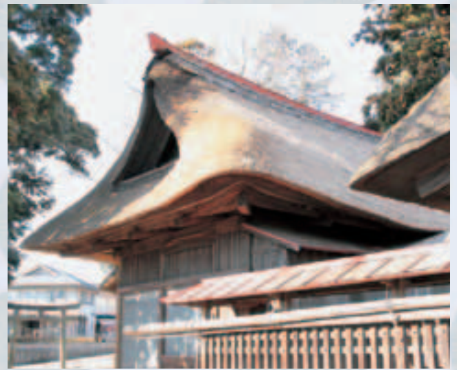
▲高浜神社 拝殿 修理期間 7/27 ~ 8/8