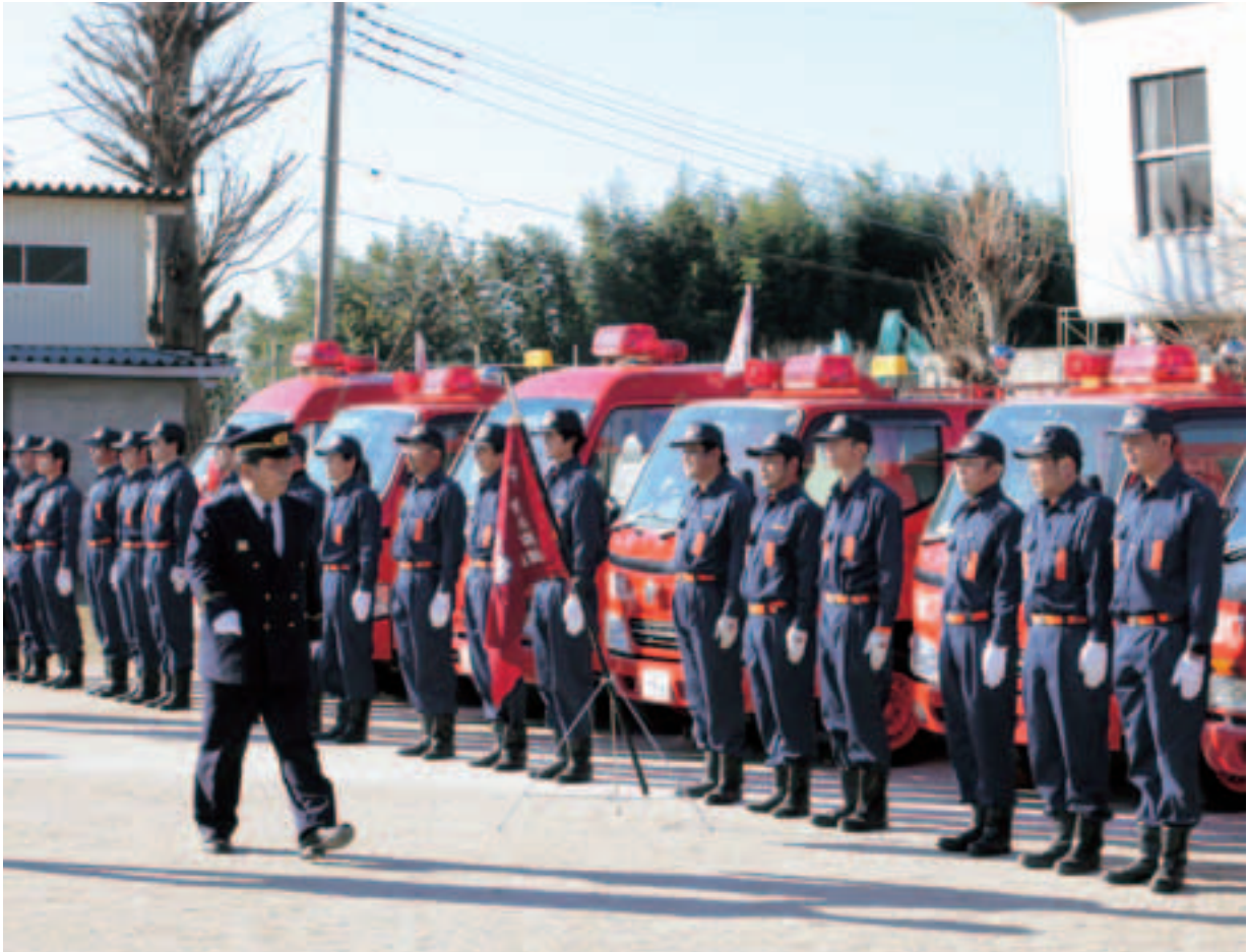
▲石岡小学校校庭にて