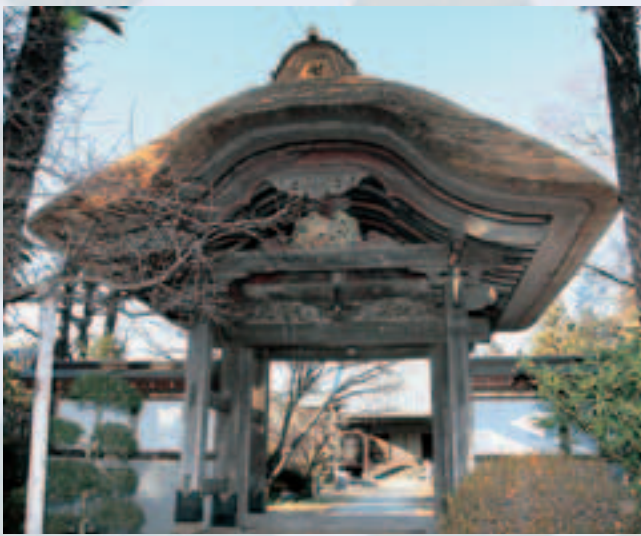
▲国分寺 旧千手院山門 修理期間 10/1 ~ 11/26