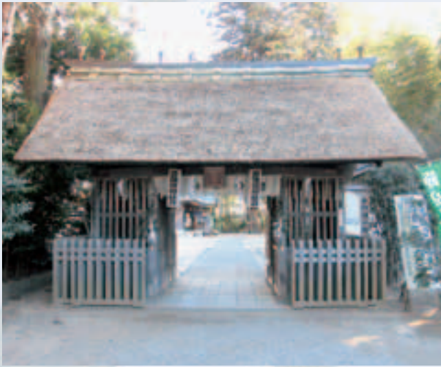
▲常陸國總社宮 隨身門 修理期間 9/24 ~ 10/31

この修理により、大切な文化財が見事によりがえり、後世へと継承されることになりました。ぜひ一度、これらの文化財を巡り、歴史のロマンを感じてみてはいかがでしょうか。