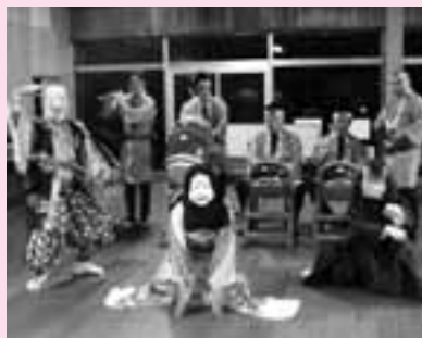
▲若松町で作成した太鼓・お面

☎ http://www.hariness.jp/kyodo/index.html