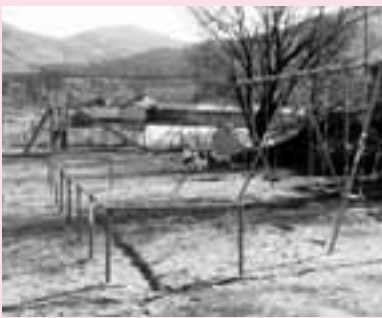
▲朝日里山学校の遊具

平成22年度宝くじ助成事業で、柴内地区では、朝日里山学校敷地内に遊具など（すべり台・