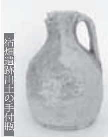
宿畑遺跡出土の手付瓶 出土している

そこで、バイパスの開通を記念し、3月7日から八郷総合支所1階市民ラウンジで、ミニ企画展「宿畑遺跡展」を開催します。