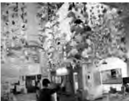
▲ロビーに飾られた吊るし雛（府中地区公民館）

府中地区公民館ロビーにも、2月3日から3月16日まで、府中女性の会が作った折り紙の吊るし雛が飾られました。これは、いつも利用している公民館を折り紙で飾り、訪れた人に明るい気持ちになってほしいと会員が10月ごろから今年1月末まで折りためてきたものです。