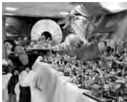
▲まちかど情報センターの雛かざり

2月12日から3月3日まで、中心市街地商店街で「いしおか雛巡り」が開催され、3500人が訪れました。今年は、市役所1階ロビーにも雛飾りが展示され、申告相談などで訪れた人の目を楽しませました。期間中は、商店街による餅つきやけんちん汁などの接待、クイズラリー、軽トラ市、總社宮での社宝公開など様々なイベントが行われました。