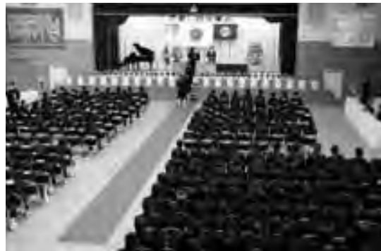
▲柿岡中の卒業証書授与

3月9日に市内の8中学校の生徒737人が、23日には19小学校の児童708人が卒業しました。小学校の卒業式は、当初18日の予定でしたが、地震により23日に延期となりました。