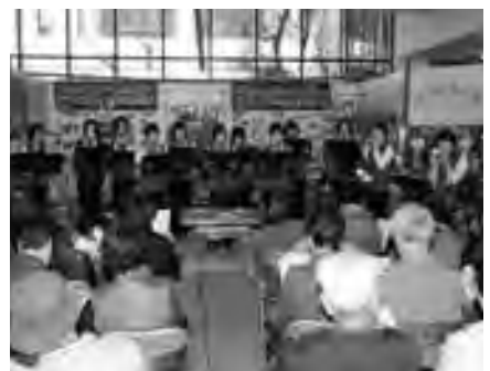
▲2月26日開催のオカリナ演奏会（中央公民館）

府中地区公民館ロビーにも、2月3日から3月16日まで、府中女性の会が作った折り紙の吊るし雛が飾られました。これは、いつも利用している公民館を折り紙で飾り、訪れた人に明るい気持ちになってほしいと会員が10月ごろから今年1月末まで折りためてきたものです。