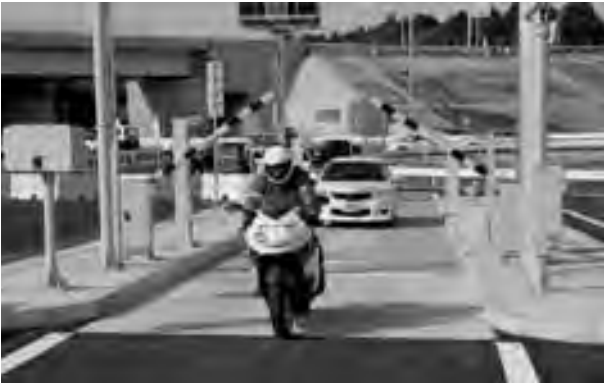
▲運用が開始された石岡小美玉スマートIC（3月24日）

当日は、予定していた開通式典を震災のため中止し、関係者による交通安全祈願と通行認定