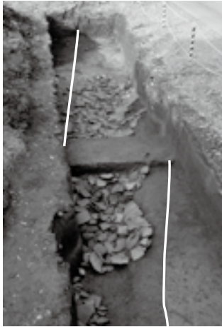
溝（白線の内側）と多量の瓦

り、排水を考慮した施設であり、区画溝と呼ばれます。したがって、この国分遺跡から出土した溝も国分寺の主要伽藍の区画溝であり、内側