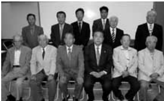
▲表彰された統計調査員