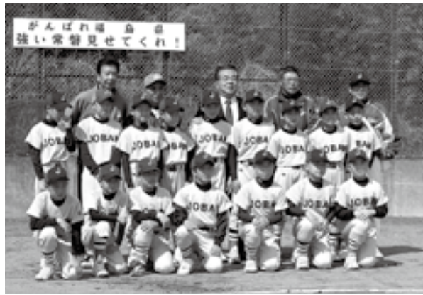
▲常磐軟式野球スポーツ少年団 (小井戸球場)

たもので、宿泊はジュニアジャイアンツの合宿所を提供し、食事もジュニアジャイアンツの保護者らが作りしました。