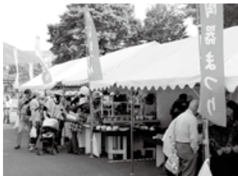
▲テントを巡る来場者

週末であったため、多くの人が訪れました。来場した人は、並べられた陶器を手にとって眺めたり陶芸家と話をしたりと、楽しい時間を過ごしていました。