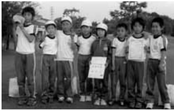
▲優勝した柿岡小チーム

5月8日、常陸大宮市の静ヒルズカントリークラブで行われた第6回スナッグゴルフ対抗戦茨城B地区予選会で、柿岡小が優勝し、全国大会への出場を決めました。