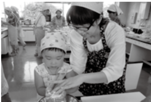
▲石岡保健センター調理室にて

食べられない野菜があったのに、自分で切ったからといっぱい食べた」「子どもたちの真剣な顔を見ることができた」「子どもがやる気になって、楽しくできた」「普段、ゆつくり手伝いをさせてあげられないので、今日は一緒に作られてよかった」などの感想が寄せられました。