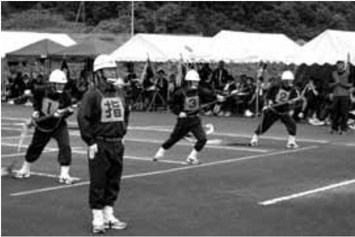
▲ポンプ車操法の部の競技風景

結果は、ポンプ車操法の部で第12分団(小幡地区)が、小型ポンプ操法の部では第11分団(柿岡地区)が、それぞれ優勝しました。この大会の優勝チームは、10月23日につくば市で開催される第62回茨城県消防ポンプ操法競技大会県南北部地区大会に、石岡市代表として出場します。参加選手の大会での活躍が、期待されます。