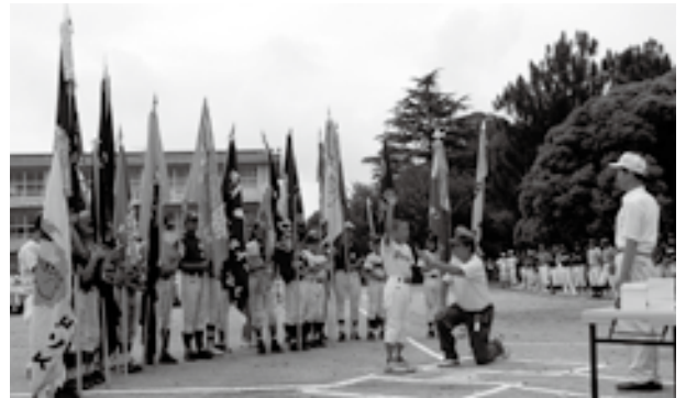
▲開会式での選手宣誓(石小校庭)

催日変更により2チームが欠場しましたが、県内30チームが参加して、猛暑の中で熱戦を繰り広げました。