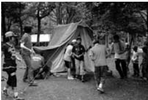
▲自分の泊まるテントを設営する子どもたち

これは、共同生活の中で、規律・協力・奉仕の心を身につけるとともに、様々な活動を通して集団生活の楽しさを知ってもらおうと毎年開催されています。今年も、雨の影響で7月23日(24日の第1期)のみの開催でしたが、参加した33人は飯ごう炊さんやキャンプファイヤー、テ