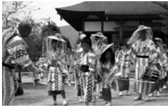
▲全龍寺で奉納されたみたまおどり

今年も、8月15日に「真家みたまおどり(国選択無形民俗文化財・県指定無形民俗文化財)」が、真家地区の寺院や新益の家で奉納されました。真家地区に伝承されるこのまつりを見ようと、猛暑にもかかわらず、市内はもとより県内各地から観光客やアマチュアカメラマンが訪れました。当日は、揃いの衣装と花笠を身につけた踊り子たちが、念仏に合わせておごそかに舞を披露し、先祖の御霊を供養しました。