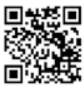
携帯電話用QRコード