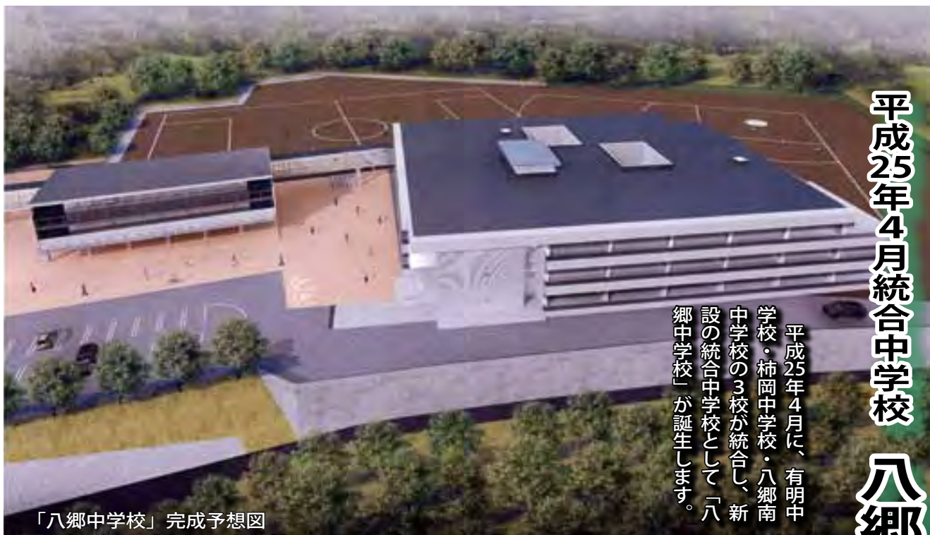
「八郷中学校」完成予想図

平成25年4月に、有明中学校・柿岡中学校・八郷南中学校の3校が統合し、新設の統合中学校として「八郷中学校」が誕生します。