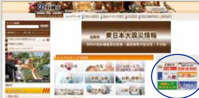
▲ホームページのトップページ