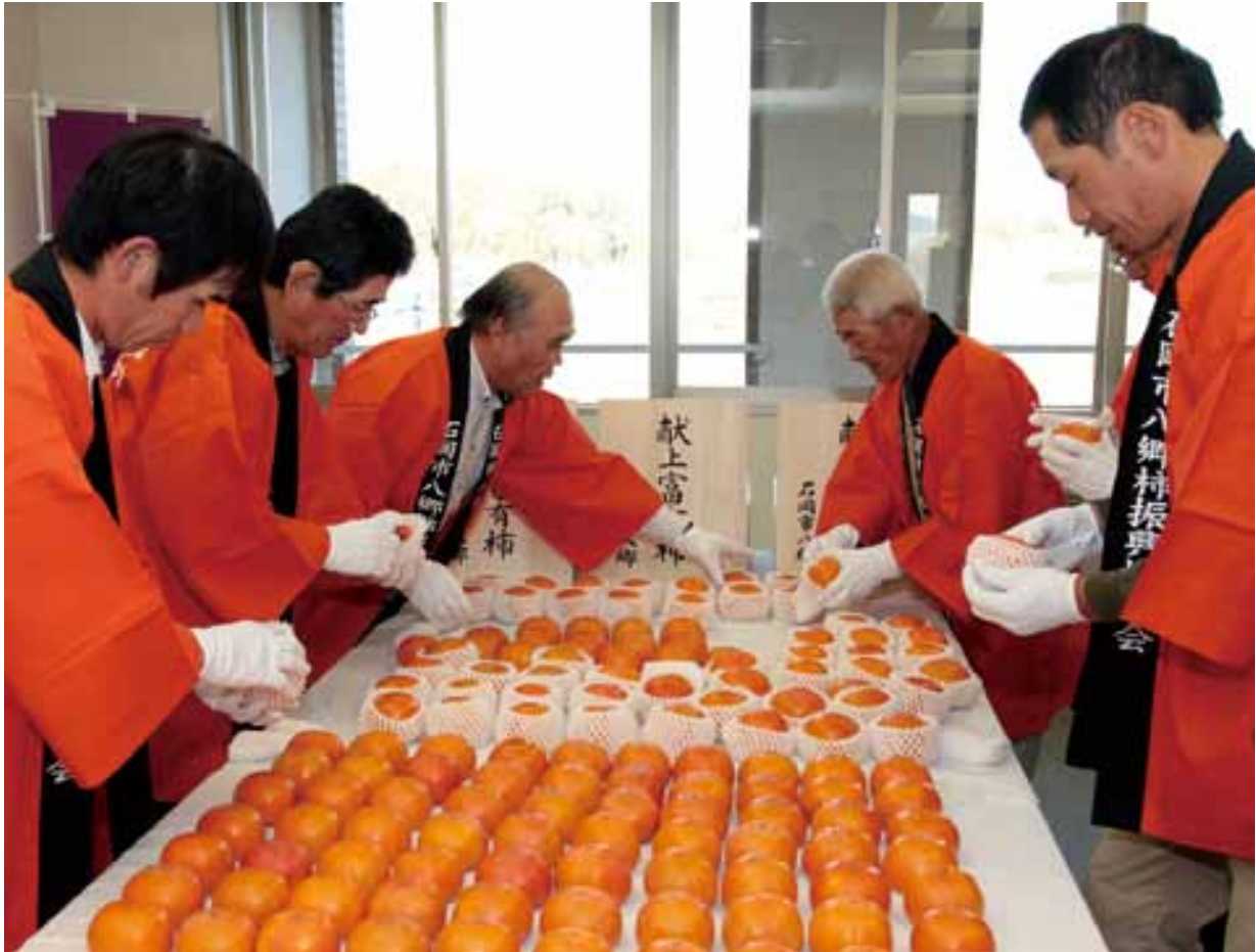
▲柿を厳選する生産者ら