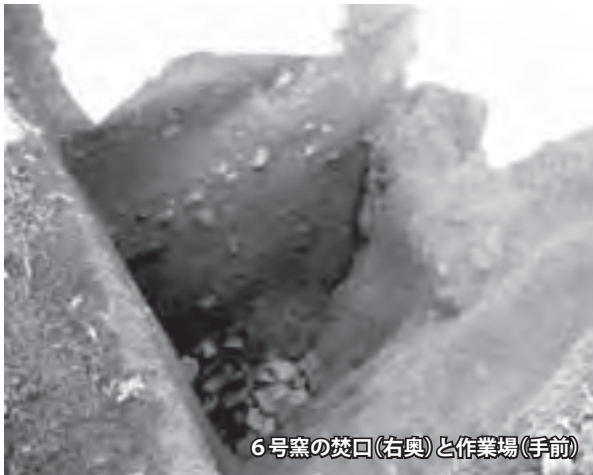
6号窯の焚口(右奥)と作業場(手前)

困難を強いられました。理由は窪んだところでは極端に土が積もっていたらしく、窯跡の深さが思いのほか深かったことです。結局、深いところでは2m近く掘ることでようやく窯跡の焚口(窯の入り口。火をたくところ)が確認されたものもありました。