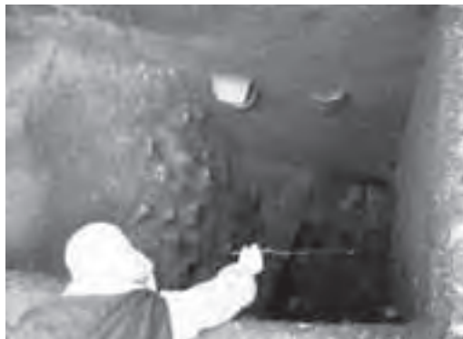
7号窯(撮影のため落葉をとっている様子)

みを掘り下げていたところ、7号窯の煙道(煙が出る場所)が確認されました。ただし、天井が落ちていてというよりは、様子が6号窯の前庭部とよく似ています。