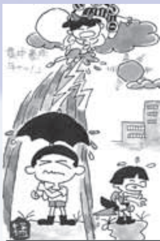
川又 小河原 猛 (66)