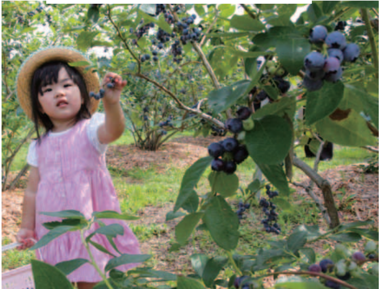
▲観光果樹園にて(昨年6月25日撮影)