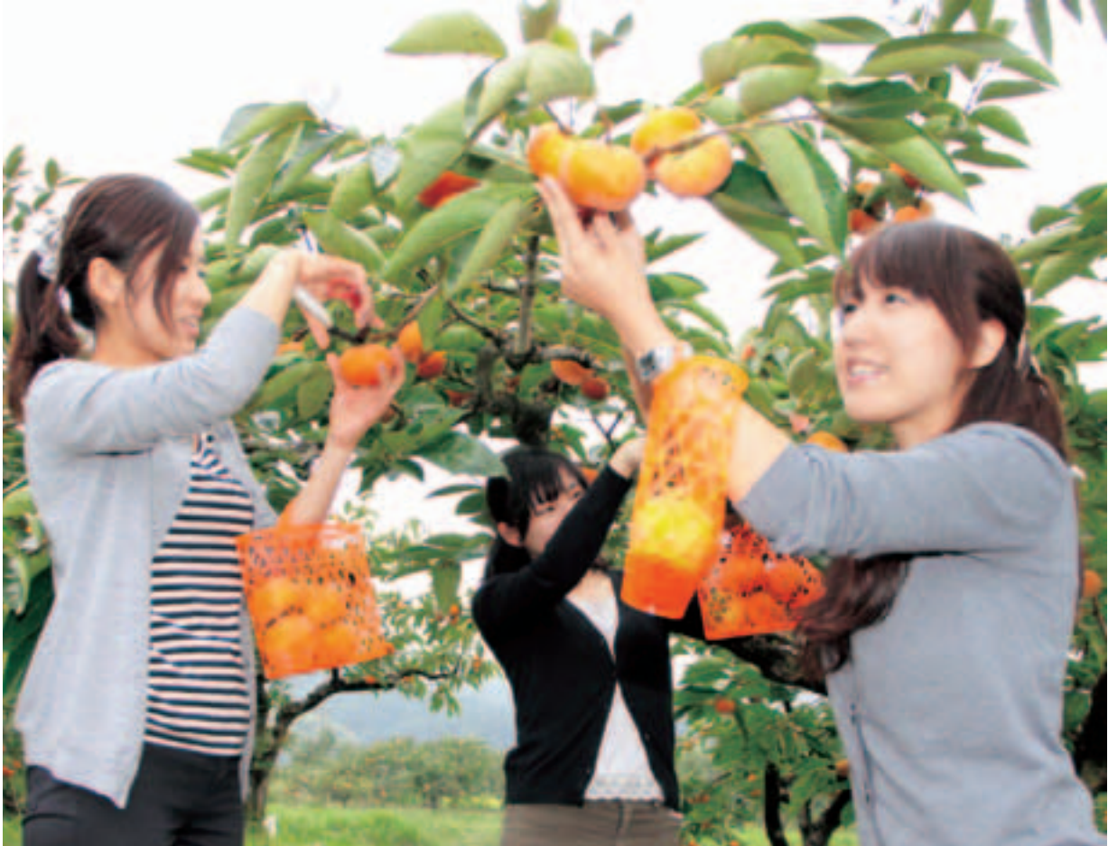
▲十三塚の果樹園にて