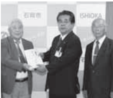
▲市長に手渡す日野会長(左)と岡田さん(右)