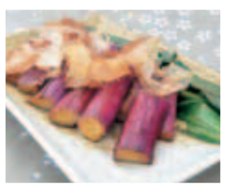
焼きねぎ(紅っこ焼き)