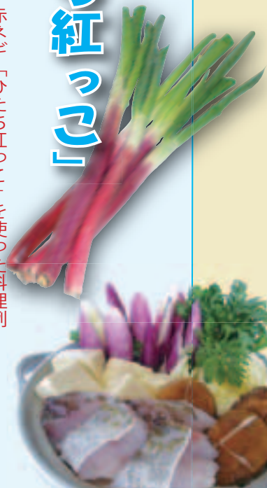
ひたち紅っこで寄せ鍋を!