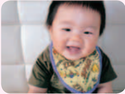
◀牛米 あおと 葵土ちゃん(9か月)