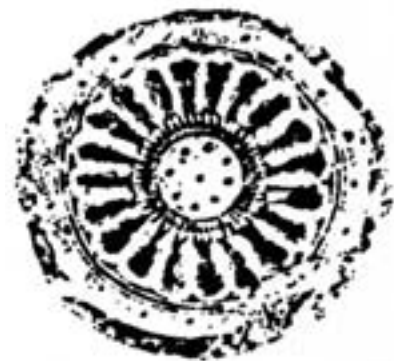
◀ 展示したものと同一軒丸瓦

とほぼ同じ位置で確認されています。文様自体は741年に創建された国分寺の創建期と全く同じ文様をしていますが、出土位置から先程の軒丸瓦と同じ年代の9世紀後半のものと思われる。そういう目で見てみると文様自体がとて退化しています。これは瓦を作る時に使う木製の版が痛んできたためで、一つの版で100年以上も使っていたこととなります。