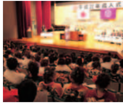
▲昨年の成人式の様子

成人式の通知は、11月下旬に発送しました。12月中旬以降になっても通知が届かない場合