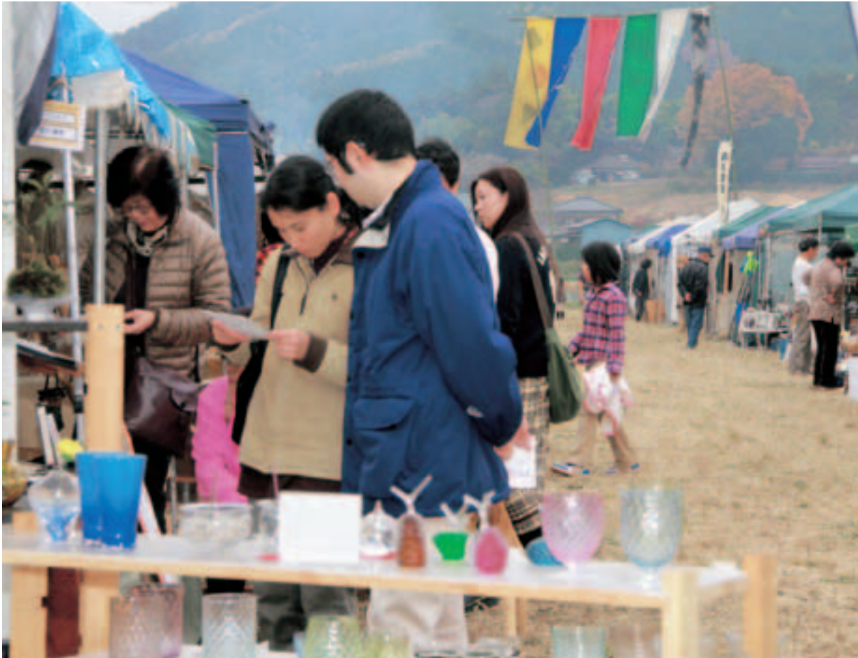
▲テントを巡る来場者