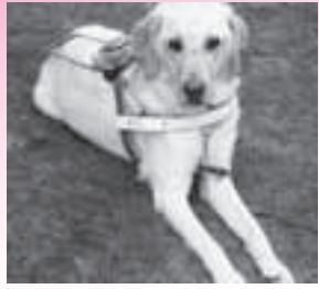
▲盲導犬フィーバス

11月4日、百人委員会ウォーキングに盲導犬と一緒に参加させていただきました。名前はフィーバスと言います。ヒトは右側通行ですが、盲導犬は左側通行なのでどうしても左に寄ってしまいます。そのため、時々フィーバスに指示することもありました。45名という大勢の方たちと一緒に歩くのは初めてなので、楽しみにしていました。