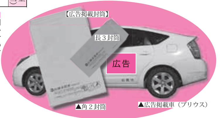
▲広告掲載車(プリウス)

市では、地域の誰もが声を掛けるため、オアシス運動を展開し、より明るく和やかな潤いのある家庭や地域づくりを進めています。 今回は、標語の部の優良賞のうち