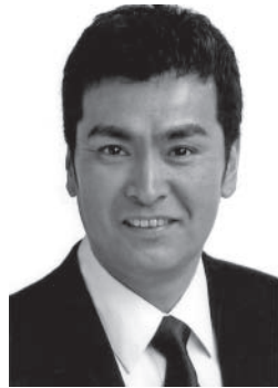
◆ 講師プロフィール