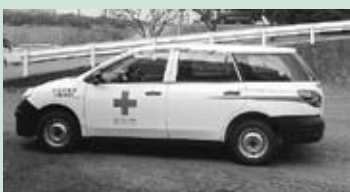
▲配備された赤十字救護車

1月30日、日本赤十字茨城県支部が、災害救護活動をはじめとする各種赤十字活動に使