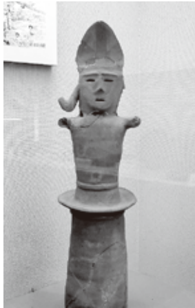
▲丸山4号墳の人物埴輪

えられます。埴輪を作るには、近くから粘土を採ってきたはずですが、とすると、丸山4号墳と西町古墳の埴輪は、別々の場所で作られたと考えられます。丸山4号墳と西町古墳の距離はわずか1.5キロメートル。また、古墳が造られた時期もさほど違いません。それにも関わらず、二つの古墳では、わざわざ違うところで作られた埴輪を使ったと考えられるのです。