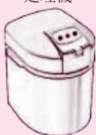
電気式生ごみ処理機