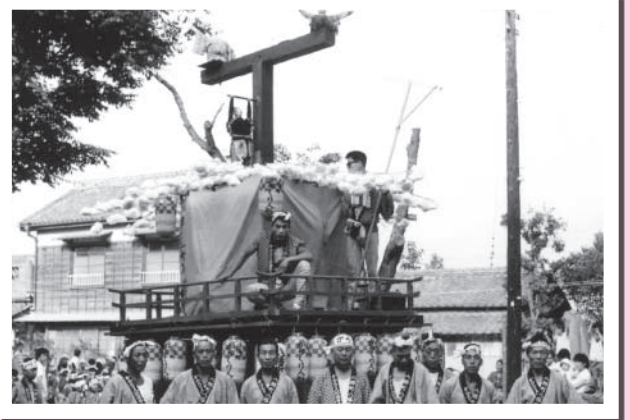
▲柿岡祇園祭 からくり人形(昭和38年7月撮影)