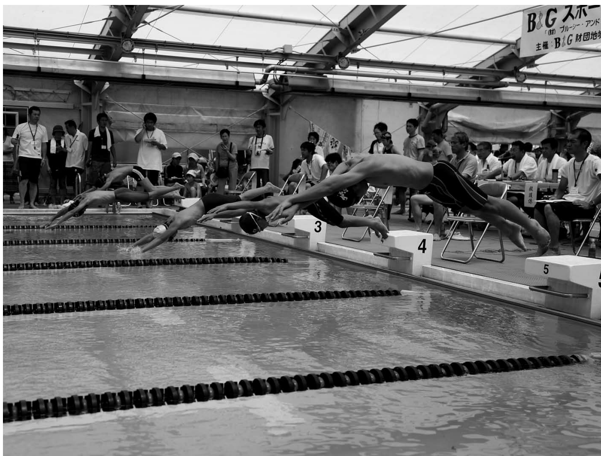
▲小学校高学年 男子50m自由形のスタート