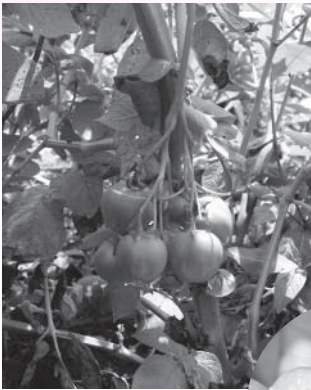
▲ジャガイモに実るミニトマトのような果実