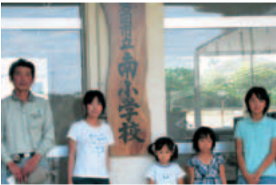
▲惣野代さんと除幕した代表児童

夏休みの親子奉仕作業日である8月23日、南小学校で校名の書かれた看板が玄関に飾られ、