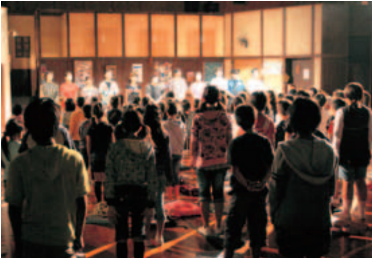
▲芸術鑑賞後、劇団員とふれあう児童たち

地域の方・保護者などが、体育館で劇団「銅鑼」の舞台を鑑賞しました。 これは、子どもたちの芸術を愛する心を育て、豊かな情操を養うことを目的に、文化庁が主催する「本物の舞台芸術体験事業」の一環として行われました。