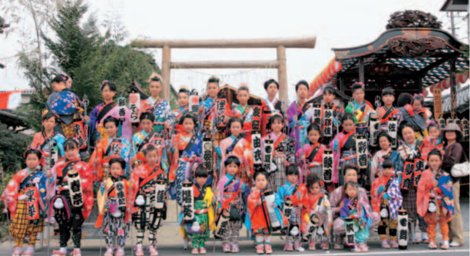
まつりの華「金棒引き」と化粧直した屋台（右奥）