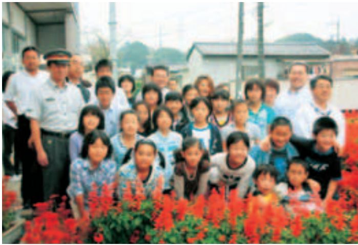
▲サルビアを飾った高浜駅前広場

このサルビアは、5月ごろから両校の児童・生徒が中心になり、「人には愛、花には水」を合い言葉に、土づくりから種まき、苗づくり、水かけなどを自