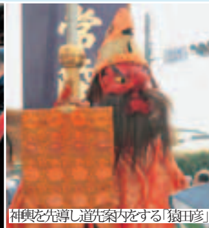
神輿を先導し道案内をする「狛犬」