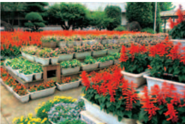
▲受賞した関川小の花壇

大好きいばらき県民会議では、「花と緑の環境美化コンクール」を開催し、潤いのある豊かな地域づくりを目指して、花いっぱい運動で成果をあげている学校や地域、団体な