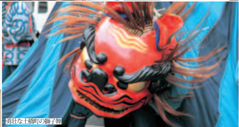
勇壮な土橋町の獅子舞