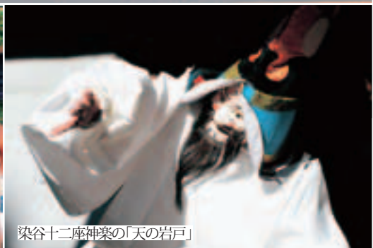
染谷十二座神楽の「天の岩戸」