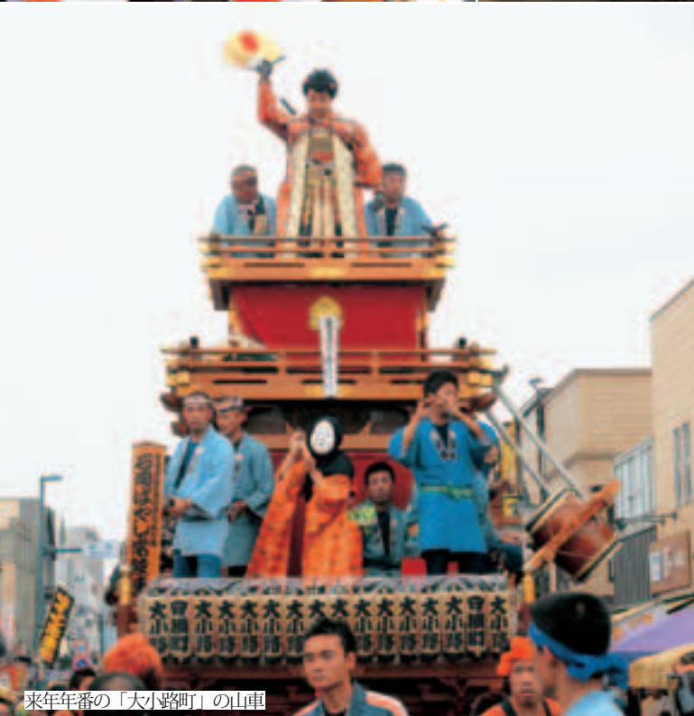
来年年番の「大小路町」の山車