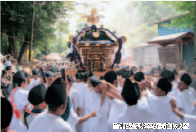
ご神体を總社宮から御仮殿へ

19日は、神幸祭が行われ、午後2時の花火を合図に、總社宮からご神体をのせた神輿が、富田のささらと土橋・仲之内の獅子を露禊に、供奉行列を組んで、年番の森木町の御仮殿へ渡御しました。御仮殿横には、今年化粧直しをした屋台が飾られました。