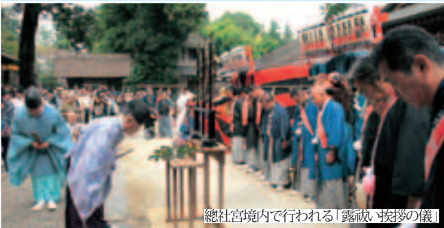
總社宮境内で行われる「露禊」の儀