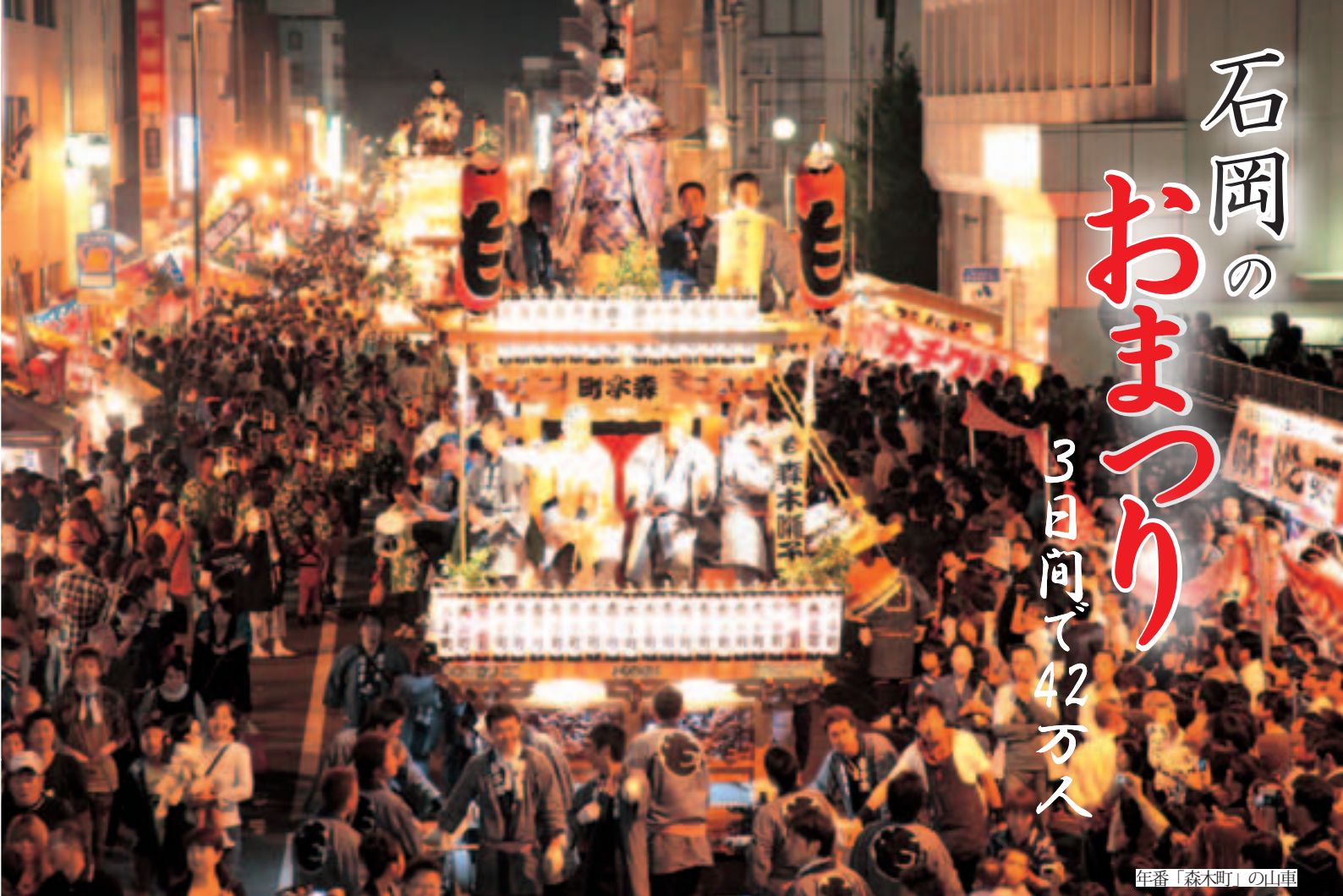
年番「森木町」の山車

「石岡のおまつり」が、秋の大型連休初日の9月19日から3日間にわたり、市街地を中心に行われました。正式には、常陸國總社宮大祭といふこの祭りに、県内外から42万人もの観光客が訪れました。華麗な山車や勇壮な幌獅子など四十数台が市内を練り歩き、市街地は祭り一色になりました。