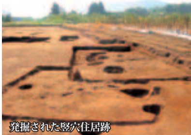
発掘された竪穴住居跡

また、土師器という素焼きの土器のほか、窯で焼かれた須恵器が出土しました。須恵器は、粘土の特徴などから、この窯で作られたものかわかります。今回は、近隣の土浦市の新治窯跡のものが多かったものの、桜川市の堀ノ内窯跡、