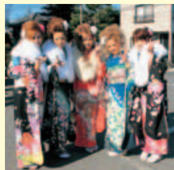
▲昨年の成人式の様子

今年度の成人式に該当するの は、平成元年4月2日から平成 2年4月1日までに生まれた人 です。該当する人には通知が届 きますが、市外に転出した人 には通知が届きません。転出した 人で、石岡市での成人式を希望 する場合は、電話またはハガキ で12月10日(木)までに、教育 委員会 生涯学習課へ申し込み