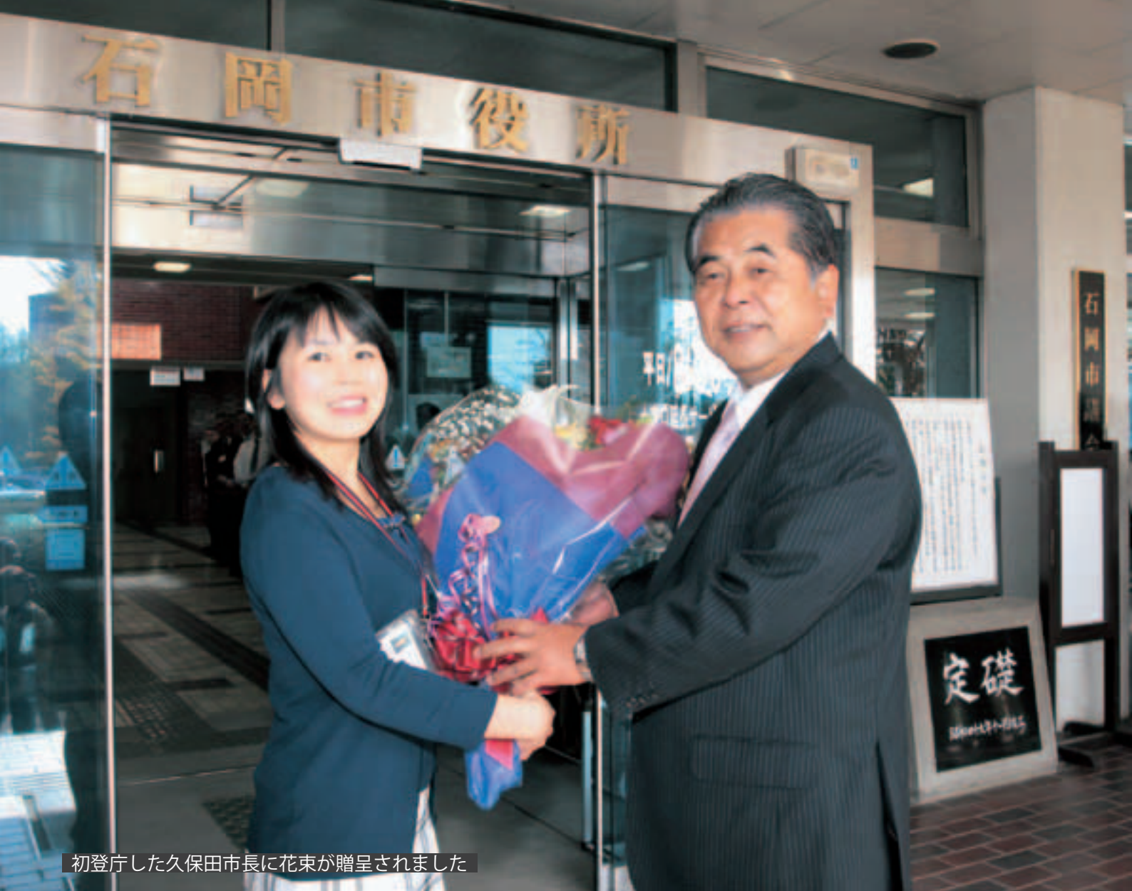
初登庁した久保田市長に花束が贈呈されました