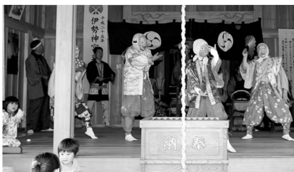
▲神社で奉納されたひよっこ踊り