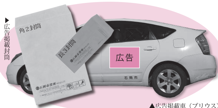
▲広告掲載車(プリウス)