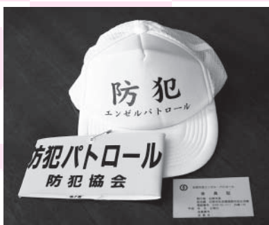
▲会員に貸与される帽子・腕章・会員証

●万が一の事故に備えて市民総合賠償保障保険(費用は市が負担)に加入しています。パトロール中に発生した事故については、その保険契約に基づいて補償されます。