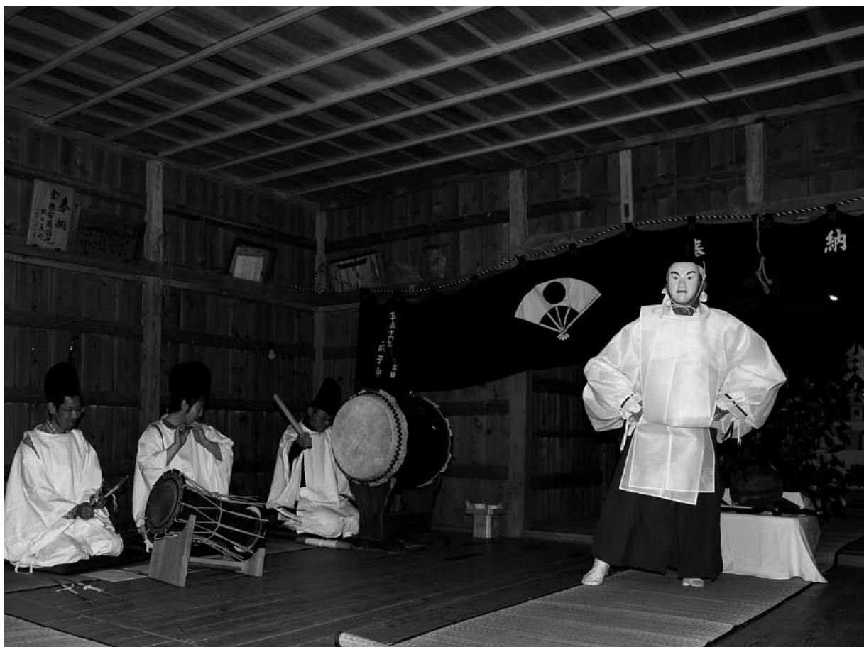
▲第三座「剣の舞」左大臣