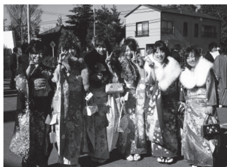
▲昨年の成人式の様子

成人式の通知は、11月下旬に発送しました。12月中旬以降になっても通知が届かない場合は、教育委員会生涯学習課まで問い合わせ願います。