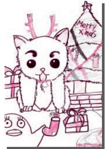
下林 岩 い 瀨 な 莉 り 奈 な (11)