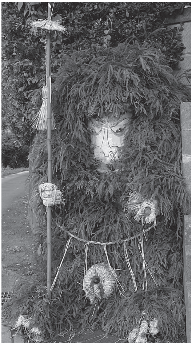
▲代田 (市指定無形民俗文化財)