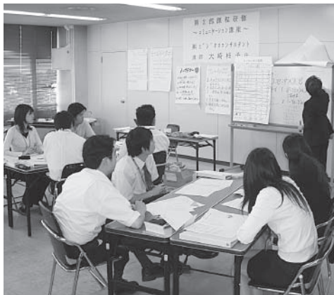
職員研修(第2部課程研修)