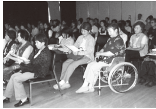
▲市内外から集まった来場者

石岡中央図書館朗読同好会が、6月7日に「大人のためのおはなし会」を、中央図書館で開催しました。