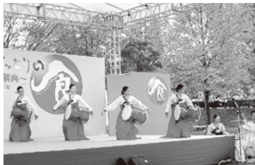
▲韓国に伝わる華麗な民俗舞踊