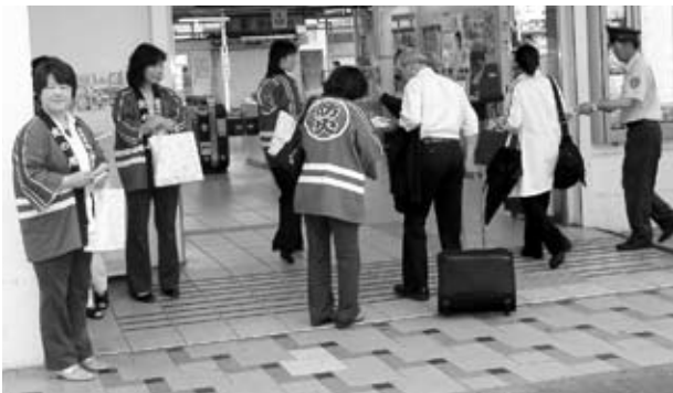
▲石岡駅前PR活動をする婦人防火クラブ員

市消防本部と市防火委員会（市婦人防火クラブ6団体）が、6月20日、石岡駅前で、住宅用火災警報器の設置を促進す