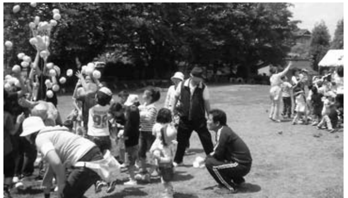
▲子どもと大人と一緒に参加した紅白玉入れ

晴天に恵まれた今年は、六軒東区を中心に近隣自治会の幼児から高齢者まで、およそ180人が参加して盛大に行われました。当日は、輪投げや綱引き、紅白玉入れやパ