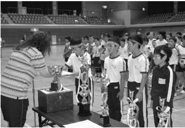
▲松金会長（左）から表彰される小幡モンキードラゴンズ

優勝は「小幡モンキードラゴンズ」、準優勝は「園部ブラックスターズ」、3位は「園部ホ