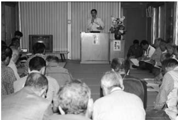
▲市職員の説明を真剣に聴く参加者

講演会終了後、参加者 は「実際の火事の状態な どをビデオで見ることが でき、大変参考になりま した。また、自主防災組 織の大切さを痛感しまし た」と話していました。