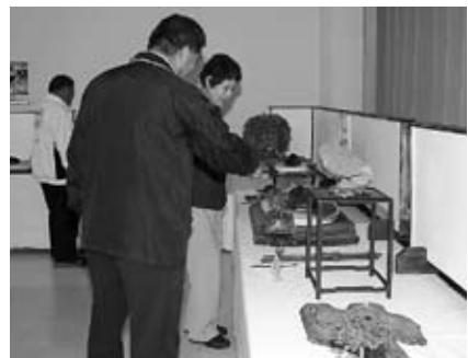
▲水石を鑑賞する来場者

5月31日、6月1日の2日間、国府地区公民館において、石岡遊石会による「第3回水石展」が開催されました。