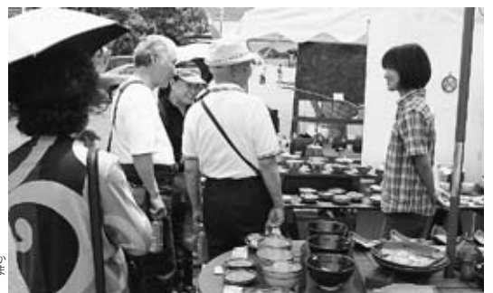
▲お気に入りの陶器を探す来場者

このイベントには、フラワー パークのバラまつり開催中であ ることも手伝って、市内外から 多くの人が訪れました。特に抽 選会場の周りには、陶器をあて ようと集まった人で賑わって いました。