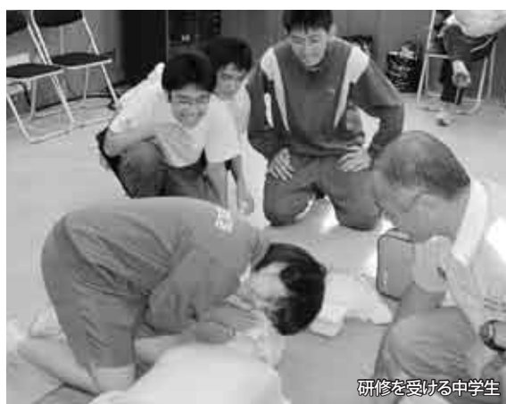
研修を受ける中学生

地域の福祉ボランティアや介護予防の担い手を養成するため、3級ヘルパー養成研修を実施します。福祉活動に興味や関心のある方、より良い家族介護技術を取得したいと考えている方々の応募を待っています。