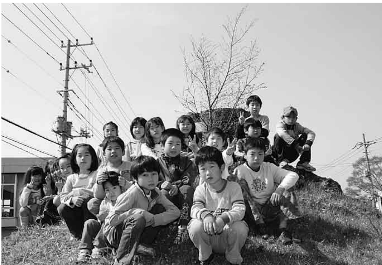
▲一里塚に集う地元の子どもたち