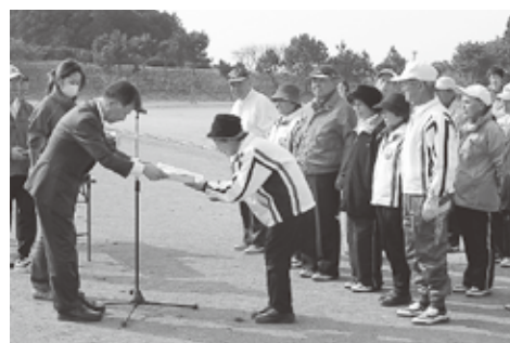
▲表彰を受ける栄松老人クラブ

3月13日、大洗町総合運動公園で第12回茨城県健康福祉祭わくわくスポーツ中央大会が開催されました。この大会のゲートボールの部で、16の地区代表チームが参加した中、市内の栄松老人クラブのゲートボールチームが、見事優勝しました。これにより、栄松のチームは10月25日から28日まで鹿児島県霧島市で開催される「ねんりんピックかごしま大会」のゲートボールに、県代表として参加します。 栄松老人クラブの今後の活躍が期待されます。