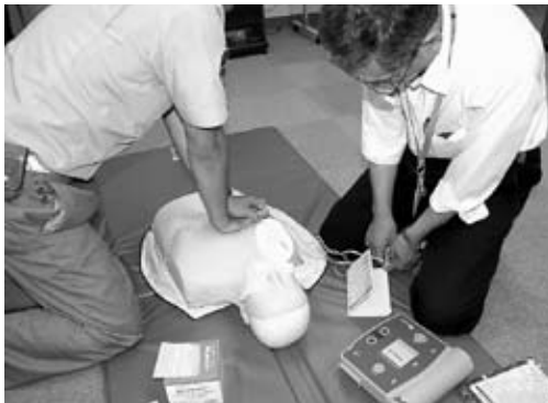
▲AEDを使用しての救急講習会の様子