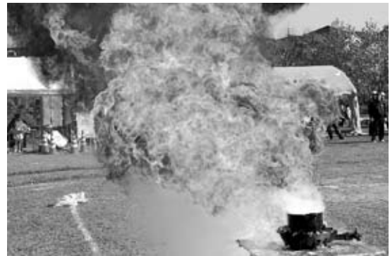
▲天ぷら油への引火(昨年の防災訓練で)