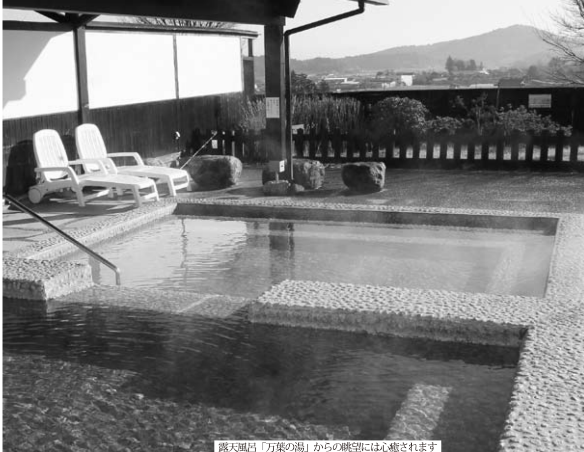
露天風呂「万葉の湯」からの眺望には心癒されます

石岡市が首都圏から隠れた日帰り温泉地として注目されていることをご存じですか。八郷地区湯袋にあるやささ温泉「ゆりの郷」。この身近な温泉には、癒しの空間・健康増進の場としてオープン当初から予想を上回る入館者が訪れ、大変賑わっています。今回は、休憩室が増築されさらにその魅力が高まった温泉施設を紹介しながら、日帰り温泉の魅力と交流空間としての可能性を探ります。