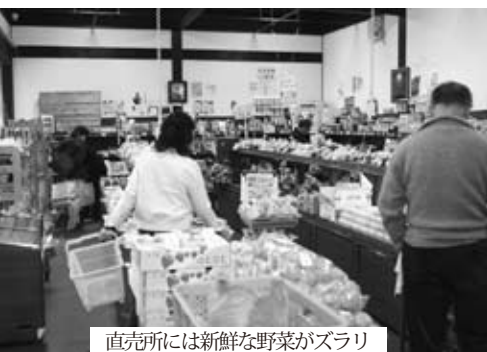
直売所には新鮮な野菜がズラリ

これまでに、やさと温泉ゆりの郷を利用した方は延べ130万人にもおよんでいます。その利用者は市内の方もいますが、多くは近県からのお客様です。このことからわかるように、すでに首都圏の皆さんからは石岡市が「癒しの空間」