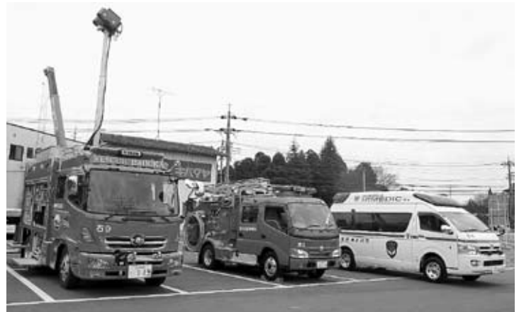
▲昨年12月に配備された救助工作車Ⅲ型、C D-I型消防ポンプ自動車、高規格救急自動車（写真左より）