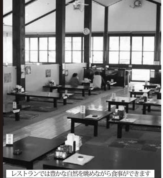
レストランでは豊かな自然を眺めながら食事ができます