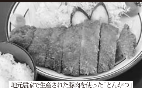
地元農家で生産された豚肉を使った「とんかつ」