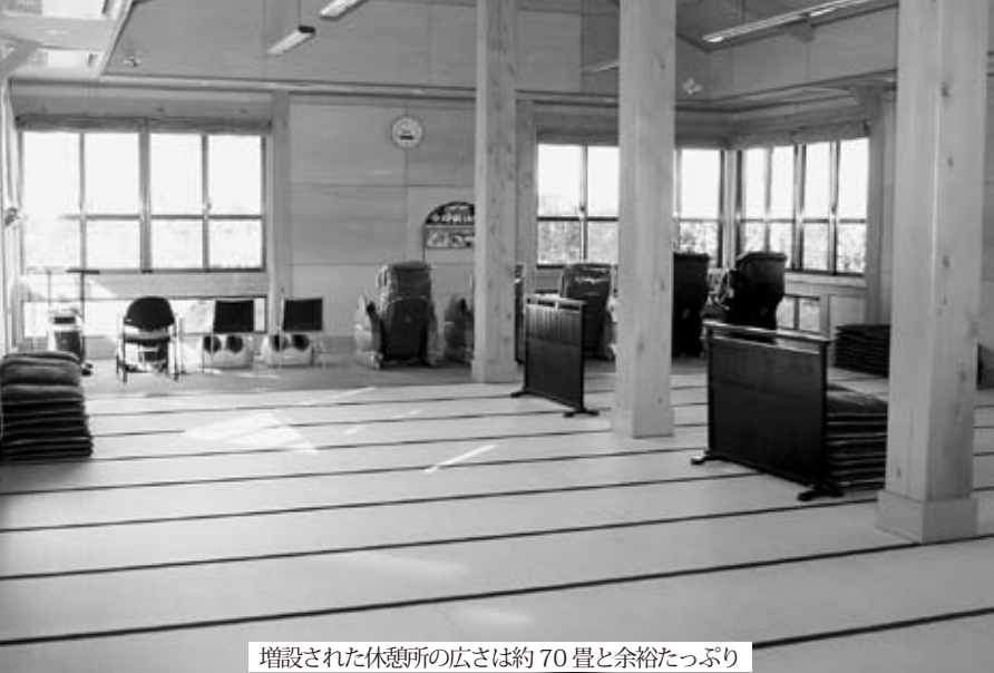
増設された休憩所の広さは約70畳と余裕たっぷり