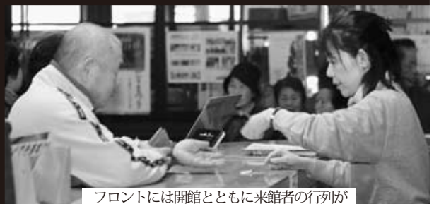
フロントには開館とともに来館者の行列が

市外から来た人が多く、「先月も来たよ」とか「月に2〜3回温泉に入りに来る」といったリピーターの方がたくさんいました。こんなことも安定した来館者に結びついているのかなと感じました。