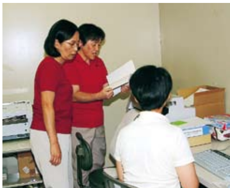
▲入力した情報を点字プリンター出力で出力します

活動に参加すれば仲間に見えるのが嬉しいし、同じ目標に向っている仲間がいることは、