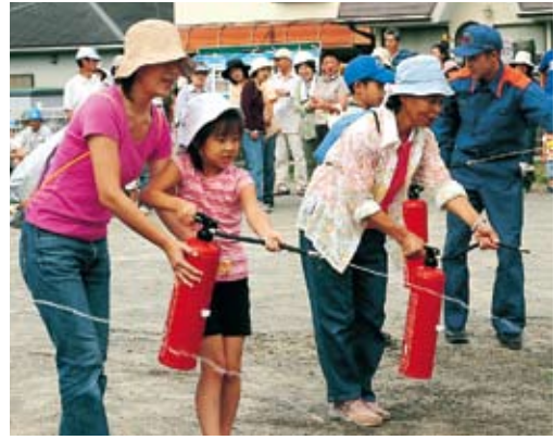
▲水入りの消火器で消火訓練をする住民