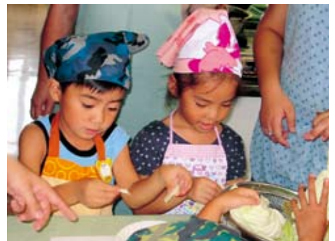
▲野菜をちぎっている子どもたち

8月10日と17日に石岡保健センターで、4日と26日には八郷保健センターで「親子クッキング