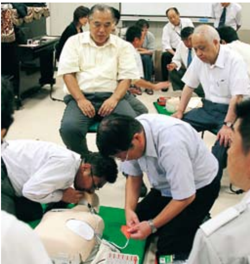
▶心肺蘇生とAED操作を体験する参加者

庁や民間施設を合わせ33か所にAEDが設置されています。市では、今後も市の施設や小中学校へAEDを順次設置してゆく予定です。