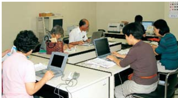
▲広報いしおかの記事をパソコン入力している様子

この会の主な活動は、広報いしおかの点訳と、月2回の光風荘でのガイドヘルプ（手引き歩