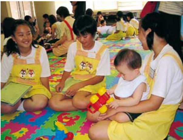
▲育児相談の場で乳幼児と触れ合う中学生

8月1日に八郷保健センターで、7日と21日には石岡保健センターでそれぞれ市内の中学生を対象に、思春期ふれあい体験学習が開催さ