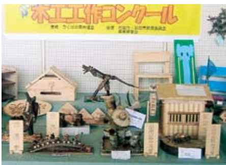
▲小学校木工コンクール作品