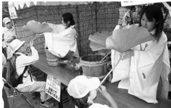
▶「碧筒杯」を楽しむ来場者

来場者は、大杯に蓮の葉や花びらをのせ、注いだお酒を飲む『荷葉杯』や、蓮の葉の中央に穴を空け、注いだお酒を茎を通して飲む『碧筒杯』、花を眺めなが