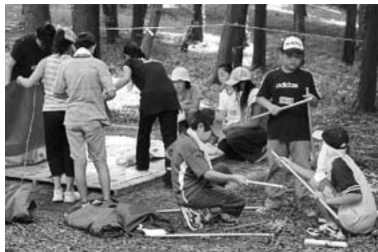
▼テント設営の様子

を身につけてもらおうと毎年開催されています。今年は、1・2期合わせて105名の児童が参加し、テント設営や飯ごう炊飯の仕方、キャンプファイヤーの仕方などを学んだり、龍神の森をハイキングしたりしました。 2日間というわずかな期間でしたが、参加した小学生たちは、日常生活から離れ、互いに協力し合って無事終了することができました。