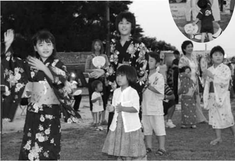
▲盆踊りを楽しむ人々と「ハッスル黄門」

8月4日、夕方5時30分から「第31回納涼市民盆踊り大会」が、いしおかイベント広場で盛大に開催されました。