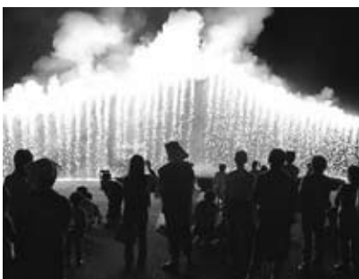
▲ナイアガラの滝の花火を楽しむ人たち

祭りの最後を締めくくるナイアガラの滝と呼ばれる花火が点火されると、会場は光のシャワーに包まれ、観客からは「わー、すごい」などの歓声があがりました。