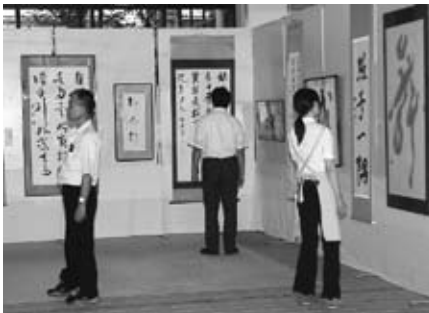
▲作品を鑑賞している人たち

この書展には、書道を愛する市内の各会派で結成された八郷硯友会会員の作品と、小中学生の作品約300点が展示されました。