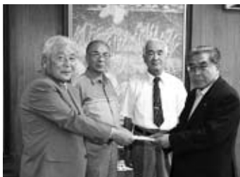
▼オカダミュージックスタジオ同好会の皆さん