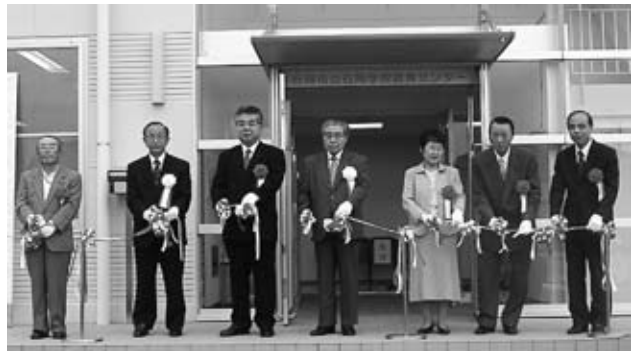
▲センター入口でのテープカットの様子