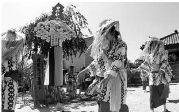
▲全龍寺でのみたまおどりの様子

会場の一つである全龍寺には、市内で唯一、国選択となっている民俗芸能を一目見ようと県内各地から訪れたカメラマンや観光客、地元の人たちが大勢訪れました。見物客の見守る中、独特の拍子に乗り、約八百年の間守り継がれてきた賑やかな舞が披露されると、皆さんから拍手