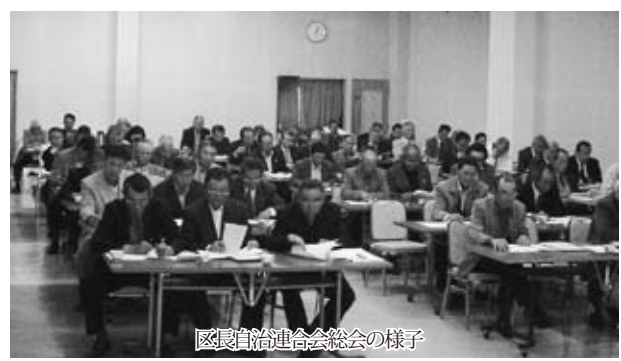
区長自治連合会総会の様子

石岡市区長自治連合会の発足にあたりまして、「いびき」として広報いしおかの紙面をお借りして、ごあいさつを申し上げます。同時に、当会の紹介をさせていただきます。