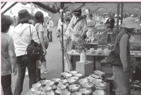
前回の陶器まつりの様子