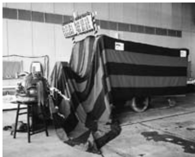
▲田中台自治会の幌獅子

平成18年度宝くじ助成事業で、田中台自治会では幌獅子（獅子頭・幌・太鼓・格納庫）を作製、月岡ふるさとコミュニティセンター運営委員会ではセンター敷地内に遊具等