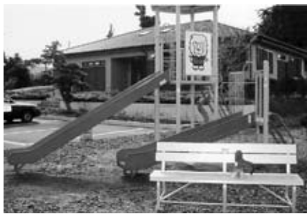
▲月岡ふるさとコミュニティセンターの遊具等

プファイヤー、野外炊飯キャンプ、うどんづくり等 屋内活動 歴史講話、空手、剣道、卓球、社交ダンス、昔遊び、クラフト活動（切り絵、紙飛行機、キーホルダー、ペトボトル風車、ウッディメダル等）、ビデオ鑑賞（ビデオテープは持参）等 申込方法 電話でお申し込みください。約1か月前に、研修内容の打ち合わせを行います。 申し込み・問い合わせ 茨城県立西山研修所 常陸太田市稲木町1699