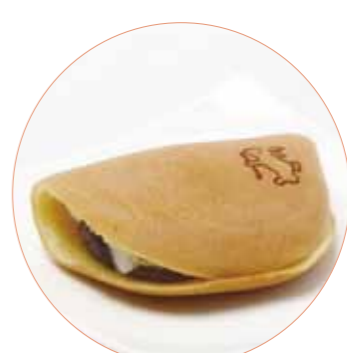
いしおかサンド 紫峰のお月さま (ブルーベリー) 手づくり和菓子高砂屋 130円