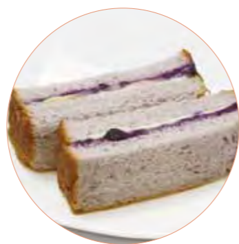
米粉ブルーベリーブレッド のいしおかサンド ブランジェ今見屋 200円