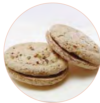
いしおかサンド 米粉のシュクセ 和菓子工房おじま 140円