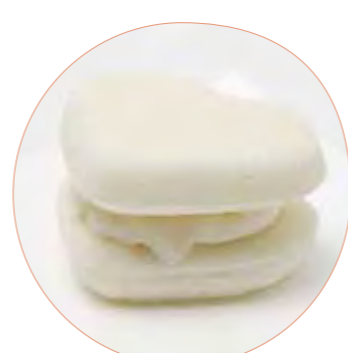
いしおかサンド 古都の香り 高野菓子店 200円