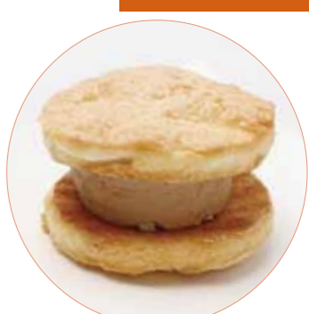
いしおか 生チョコサンド 銅山堂 200円