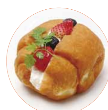
いしおかベリーサンド 土田菓子店 200円