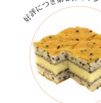
いしおかサンド 市産ごまのケーキ 羽鳥屋 210円