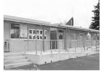
▲福祉業務を行う仮設庁舎 No. 2