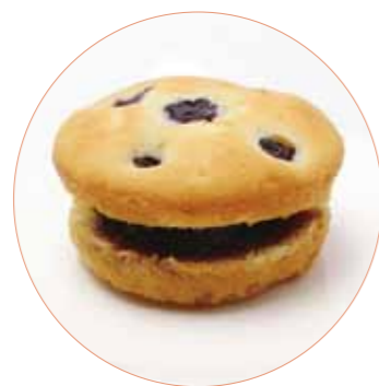
ブルーベリーとヨーグルトの いしおか米粉マフィンサンド こばやし菓子店 150円