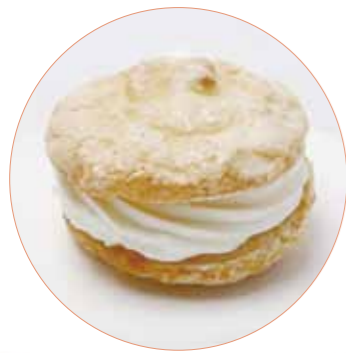
いしおかサンド 米粉のダックワーズ 池田菓子舗 200円