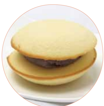
いしおかサンドこめっ娘 (ブルーベリー) 小林製菓 150円