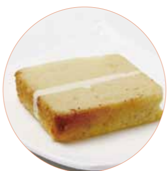
いしおかサンド ル・リ プティグリオ 200円