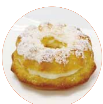
ゆずジャムとクリーム チーズのいしおかサンド スガヤベーカリー 180円