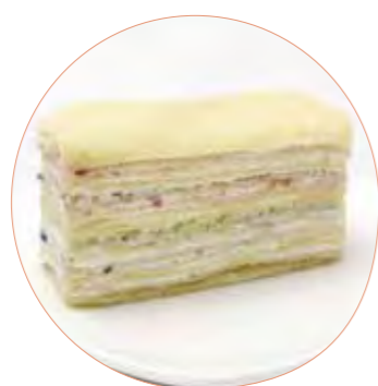
ミルクレープ風 いしおかサンド ぶれっどのケーキ屋さん 230円