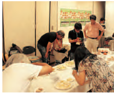
▲ブロガー記者会見での試食会。真剣に カメラを向けるブロガーの皆さん。

「いしおかサンド」を口コミ で広げていく目的でブロガー (ウェブサイトで情報発信して いる人)を記者として招待し、 「いしおかサンド」について記 者発表をする「ブロガー記者会 見」のイベントを開催しました。