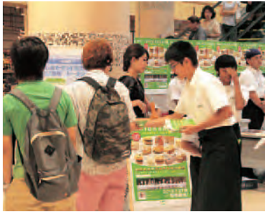
▲職場体験の中学生が積極的にパンフレ ットを配り、「いしおかサンド」をPR。

つくば市イベント 8月8日 辻口シェフらのトーク ショー・市内中学生の 職場体験 つくば市稲岡にあるショッピ