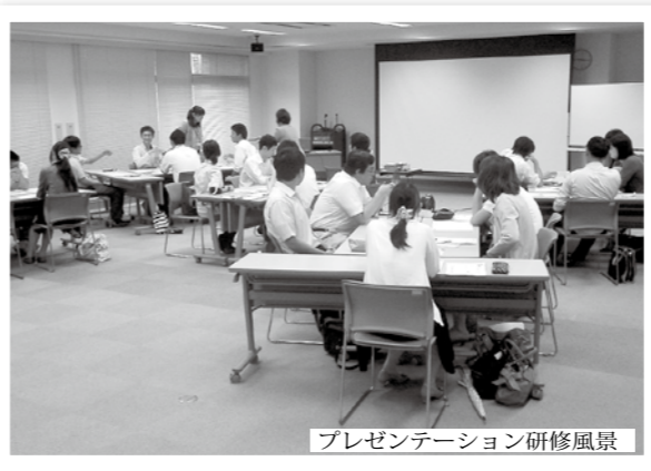
プレゼンテーション研修風景