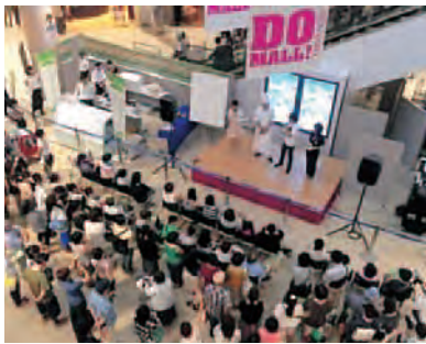
▲トークショーで会場は盛り上がり ました。

つくば市イベント 8月8日 辻口シェフらのトーク ショー・市内中学生の 職場体験 つくば市稲岡にあるショッピ