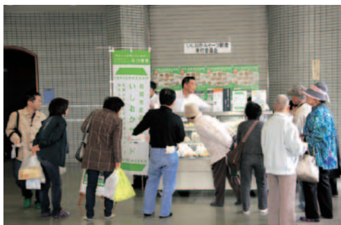
▲産業祭での「いしおかサンド」販売。たくさん購入してくれてありがとうございました。

先月号までのお伝えしてきた第4弾のサンドづくり。いよいよ11月24日に発売となります。同日開催されるイベント内で販売も行います。