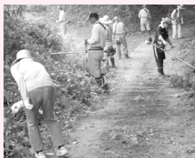
▲半ノ木地区の清掃活動の様子

「自分たちの住む地域をきれ いで気持ちの良い環境に」を合 言葉に区内や隣接する道路の清 掃活動を行っています。国道 355号線の1・3kmの草刈り やごみ拾いなどを年に3回実施 しています。