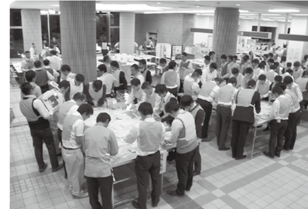
▲開票の様子 (八郷総合支所)

任期満了 (11月5日) に伴う石岡市長選挙が10月20日告示され、27日の午前7時から午後6時まで市内52か所の投票所で投票が行われました。