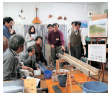
▲小型実験の様子。地形がどのように形成されたかがよく分かります。

☎029-831-1111 ✉geo298@info.tsukuba. ibarakijp