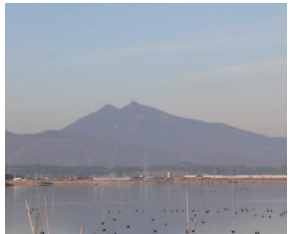
▲霞ヶ浦から望む筑波山。現在、筑波山地域ジオパーク推進協議会では、筑波山地域の日本ジオパーク認定を目指しています。