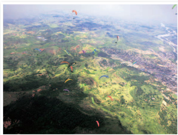
▲ワールドカップが行われた、ブラジル南東部ゴベルナドールパラダレスの町。なだらかな丘陵地帯が続く様子は八郷地区の盆地に似ているそう。