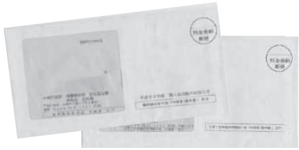
▲臨時福祉給付金の申請書は「平成26年度個人住民税のお知らせ」に同封しています

●子育て世帯臨時特例給付金について こども福祉課 ☎23・11111 (内線174)