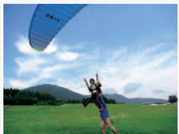
▲市内のパラグライダースクールでは、自分の力で飛ぶ体験ができます。

ながら海の方角にアルファベットのCの字に開いた地形は、上昇風を吹かせてくれていきます。ここは風が集まりやすい場所なんです。ね。 良い風が吹いている、雪が降らないから1年を通して飛ぶことができる。本当に最高の場所です。