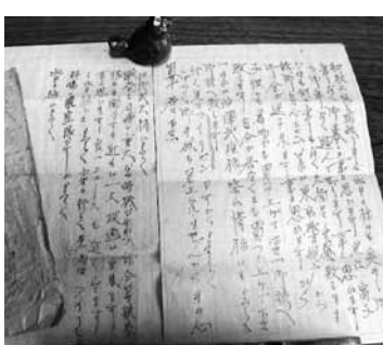
▲戦地に行く前に母に送られた手紙

歳で、妹は生後間もないころでしたので、父の顔、声すら覚えていません。父親は警視庁に勤めており、私たちは東京に暮らしていました。出征してから、石岡市の茨城に母の生家がありましたので、そこでお世話になっていました。しだいに戦火が激しくなると、石岡にもB29が上空を飛ぶようになり、私たちは、竹山に隠れたり、茶畑に隠れたりしていました。そのころ近くで農作業をしていた人たちが被害にあったと聞き、幼心にも恐怖におののいた記憶があります。父親は、出征した翌年の5月5日にフィリピンのルソン島で還らぬ人となりました。37歳で戦地に赴く前に、母親に宛てた手紙には、私たちを気遣う言葉が綴られています。それが最後の手紙になるとは。