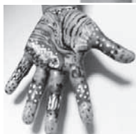
▶臨床美術・臨床美術士は、日本における(株)芸術造形研究所の登録商標です。