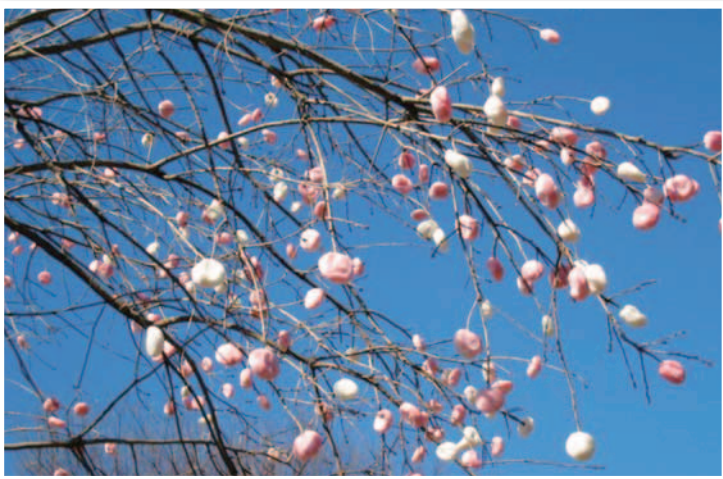
▲青い空に良く映える紅白のならせ餅