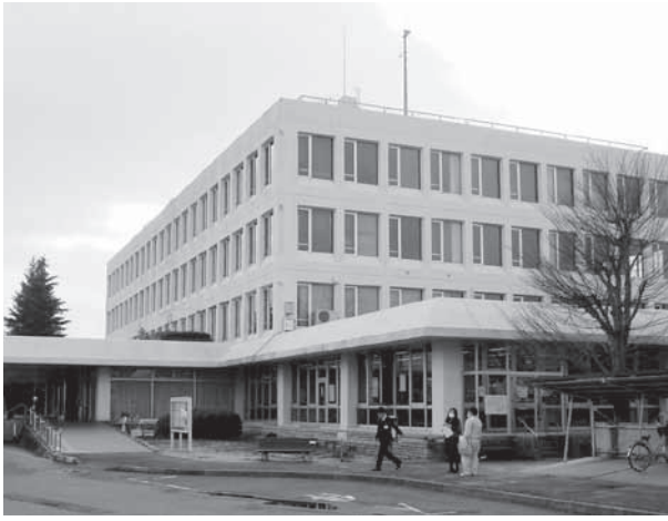
建設位置は現在地に