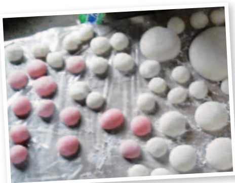
▲つきたてのお餅を小さく丸めます