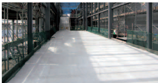
▲一部利用に向けて工事が進む東西自由通路