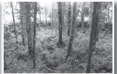
▲東大橋の掩体壕。現在でも残っているものは3基。攻撃機や戦闘機が格納できるよう周囲を土手で囲っています