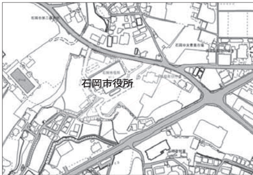
用途地域変更予定箇所