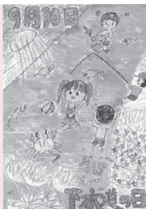
平成26年度茨城県下水道 促進週間コンクール 知事賞特選作品

作品は支所の1階市民ラウンジに10月中旬ごろ展示する予定です。 下水道の役割を深めてもらうため、市内の小中学生を対象に、ポスター・書道などの「下水道コンクール作品」を募集しています。 下水道の役割とは？ お風呂や台所、トイレなど家庭から出る汚水を下水処理場に集めて浄化し、自然に返す大切な役割を担っています。 下水道の役割を深めてもらうため、市内の小中学生を対象に、ポスター・書道などの「下水道コンクール作品」を募集しています。