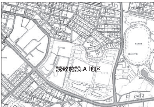
地区計画変更予定箇所