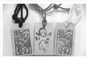
◀おまつり気分を盛り上げるオリジナル木札をプレゼント

申込方法／直接または電話(平日の午前8時30分～午後5時15分)で申し込み。 直接窓口申し込みできない人はファックス・メール・ハガキなどで氏名・性別・年齢・住所・連絡の取れる電話番号を記載の上、お申し込みください。 ※駐車場の準備のため、自家用車で来場する参加者は事前にお申し出ください。 ☎ 23・1111 (内線142) FAX 23・2225 machikyou@city.ishioka.lg.jp