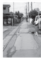
▲当時の滑走路は戦後70年経ち、真っ直ぐな道路になっています

国道6号線の石岡市役所入口交差点の水戸寄りにある中古車展示場やカラオケボックスから、北側へと1km以上にわたって延びる直線道路が3本あります。これが航空基地（飛行場）の滑走路跡にあたります。配備されていた攻撃機は「天山」などのようですが、それらは空襲から守るための施設「掩体壕」に格納されていました。